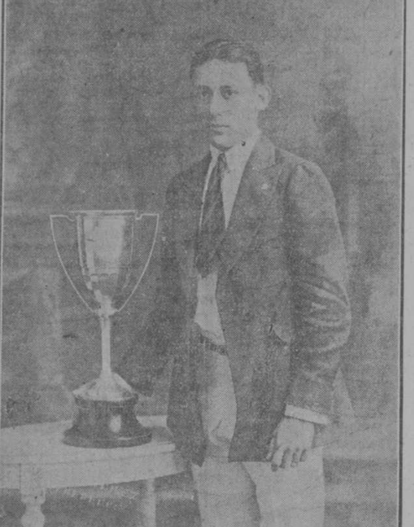
Ganador de la Copa "Antonio Gonzalez Mora", por acumulación de 15 puntos en las competencias de track entre el "Montserrat", "Start", "Náutico", celebradas en el Hipódromo de Cienfuegos y ganadas por el "Montserrat". Febrero 24 de 1924.