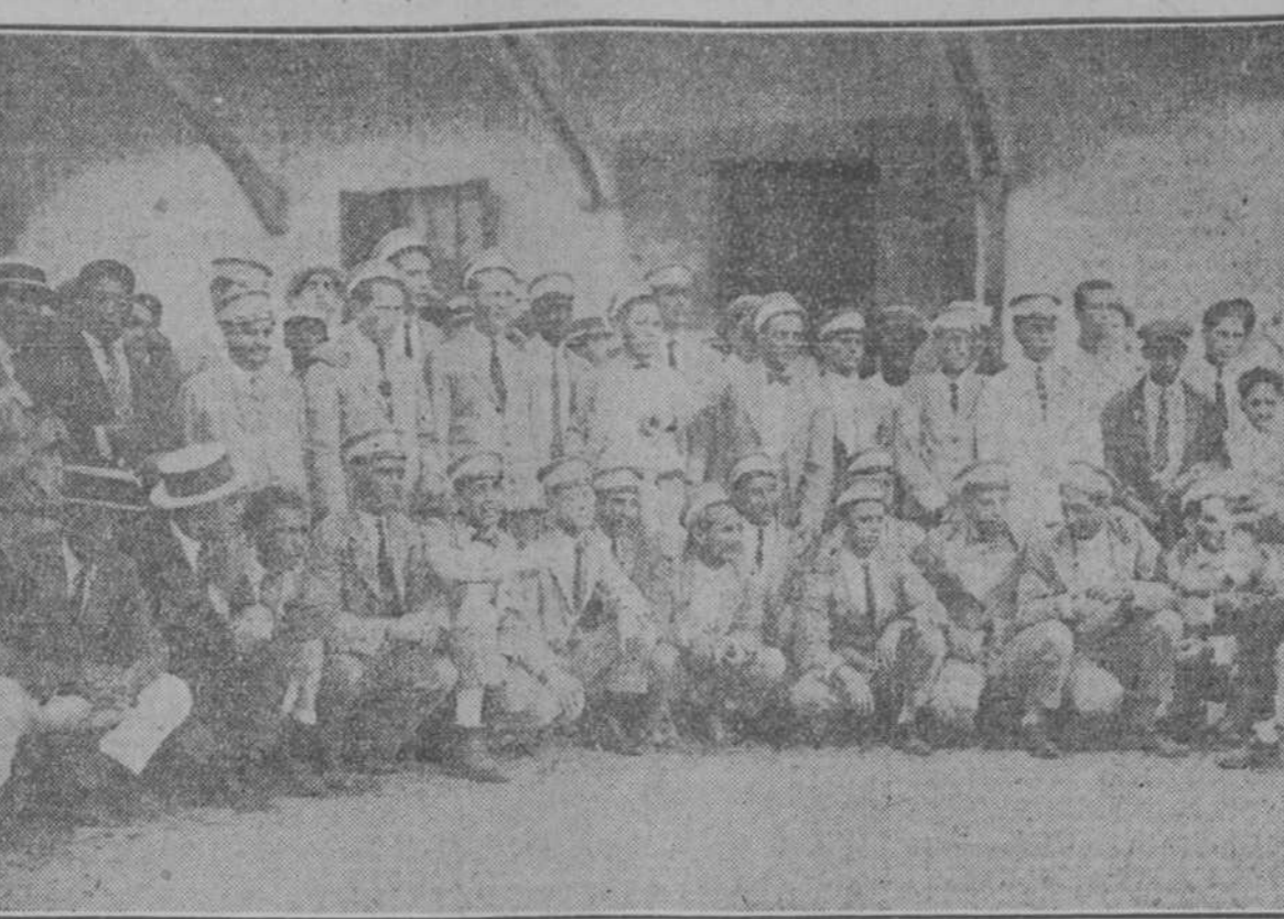
Esta fotografía que aún no habíamos publicado, demuestra el entusiasmo de conductores y motoristas por el base ball, y por las glorias nacionales cubanas. Ellos formaron crecido número que dieron la bienvenida al pitcher Mundial en la tarde del día 2.