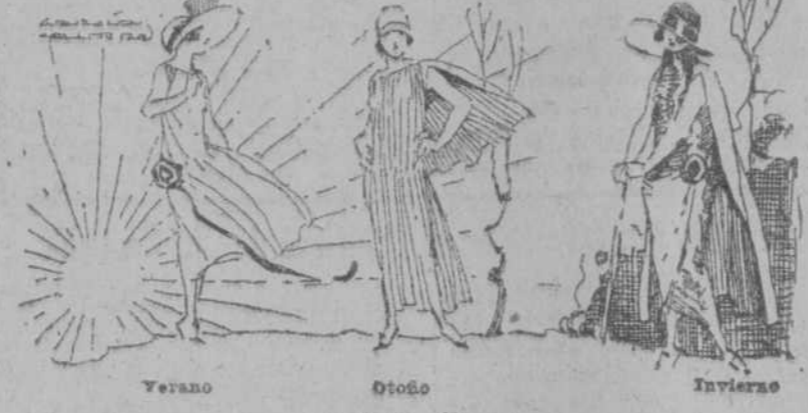
Verano Otoño Invierno

¡Cuántas veces habrá pagado Ud. más dinero del que debió pagar por alguna frazada que tal vez ni muy remotamente pudiera acercarse en calidad a las que hoy tenemos el gusto de ofrecerle!