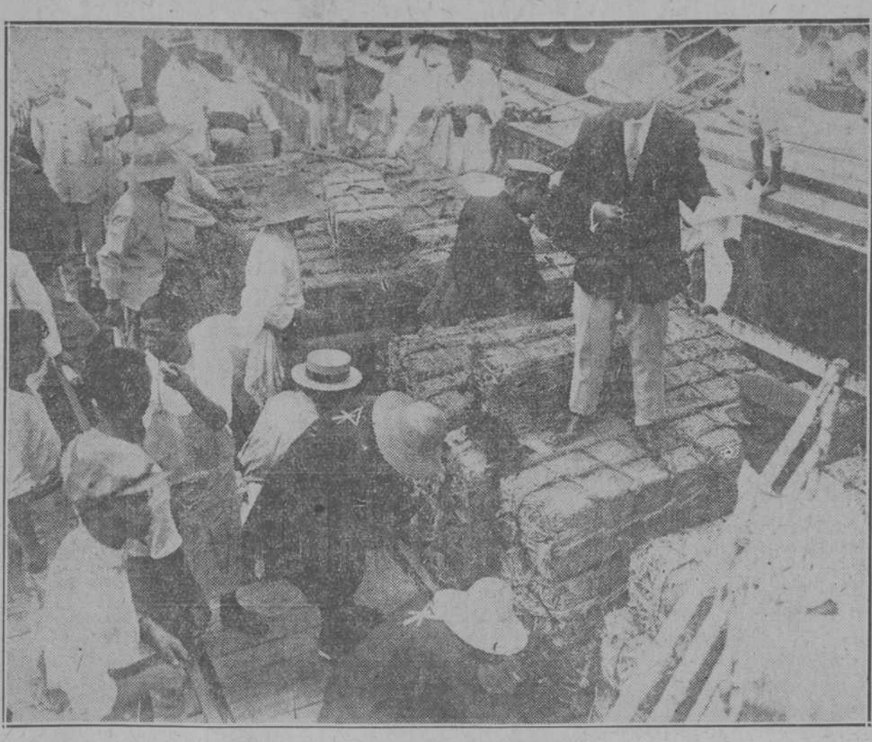
Esta fotografía muestra el primer barco, que lleno de provisiones para los refugiados, víctimas de la catástrofe de Tokio y Yokohama, abandonó el puerto Osaka. Con febril actividad los trabajadores japoneses se disponen a prestar eficaces auxilios a sus compatriotas desamparados.