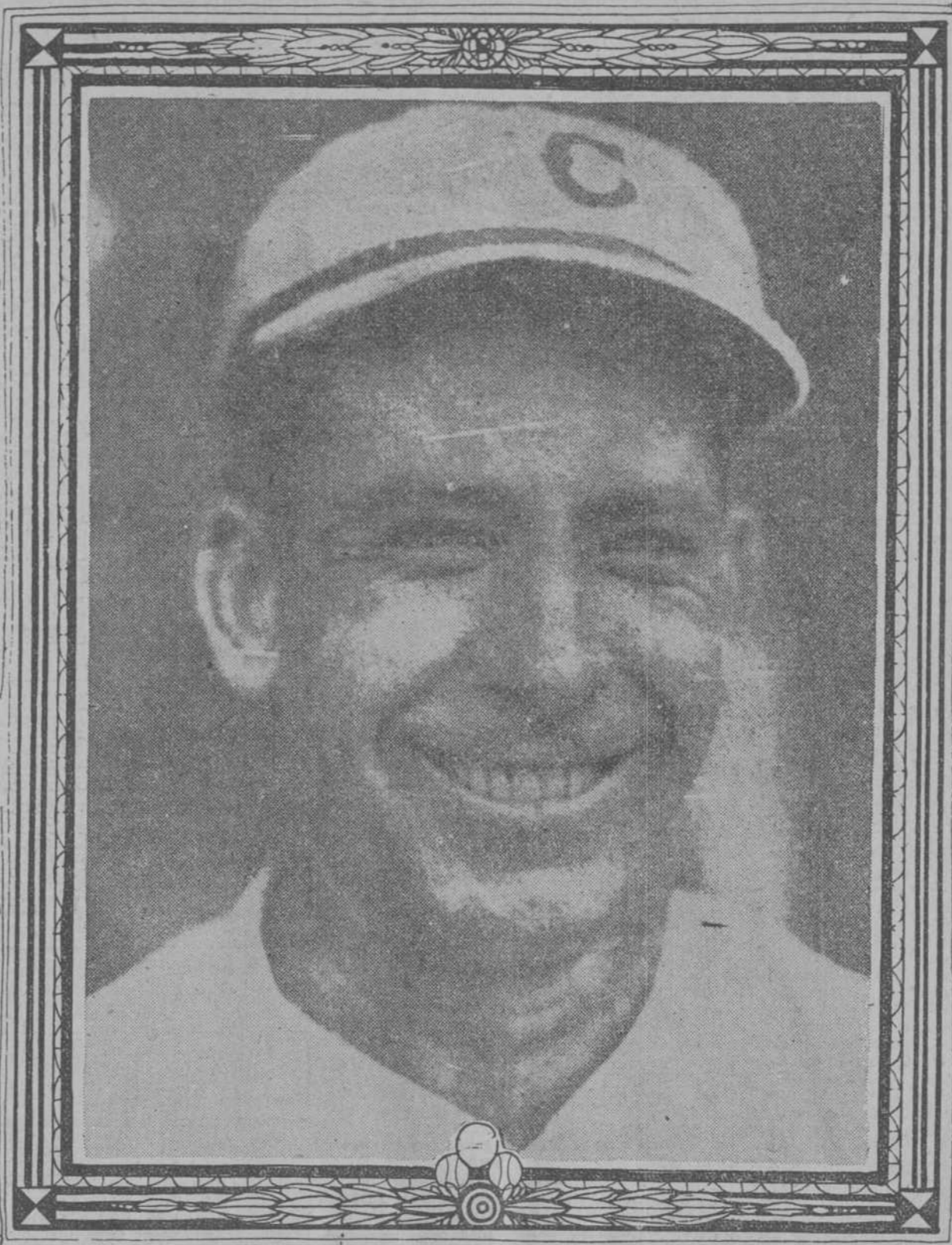
Adolfo Luque, el maravilloso pitcher cubano vencedor en las grandes ligas Americanas que ha de llegar a esta ciudad en la tarde de mañana, y al que se le prepara el más grande, entusiasta y merecido de los homenajes.