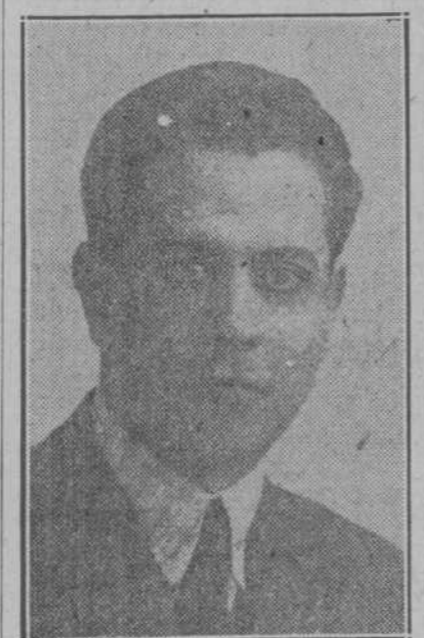
José Raúl Capablanca, Champion Mundial de Ajedrez.