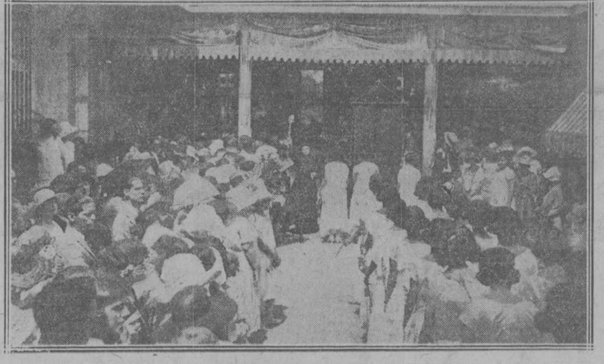
Aspecto de la concurrencia en la fiesta de la Escuela del Hogar celebrada ayer.