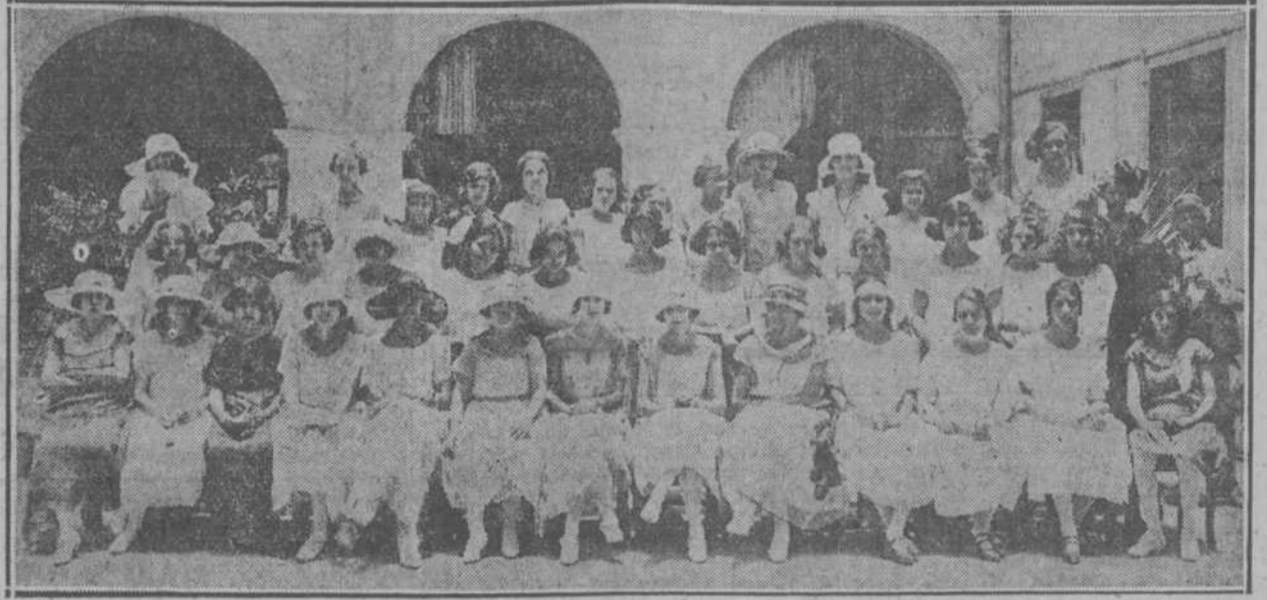
Interesante grupo de las alumnas de la Academia