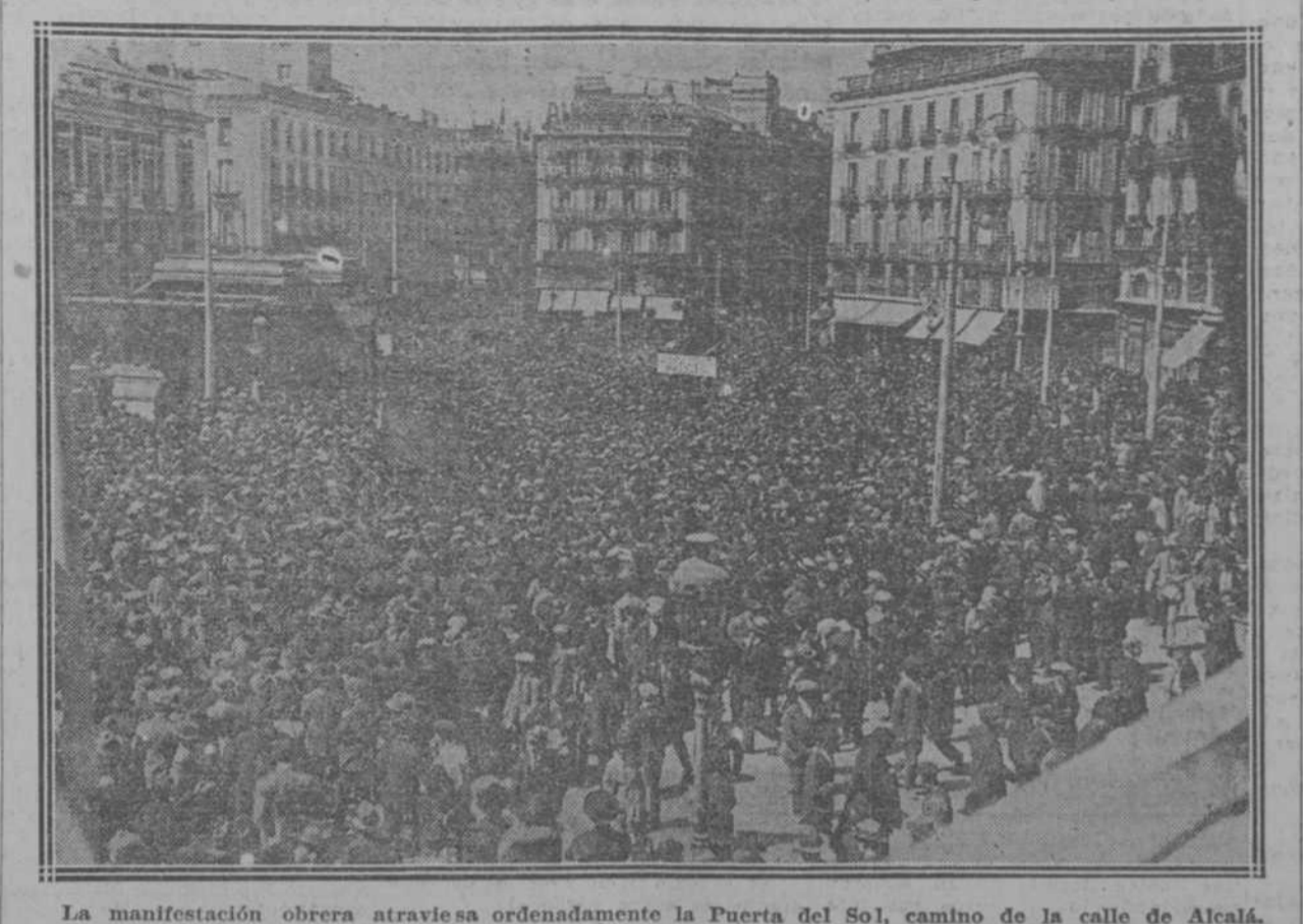
La manifestación obrera atravesada ordenadamente la Puerta del Sol, camino de la calle de Alcalá.