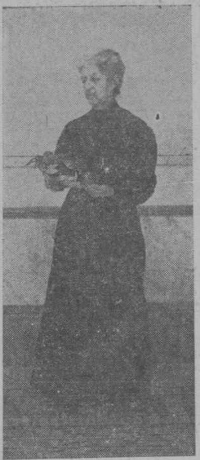
La distinguida escritora cubana, señora Gertrudis Gómez de Avellaneda, con la corona de laurel de la Avellaneda en las manos.

Hace 63 años, que el pueblo cubano el día 27 de enero de 1860, por iniciativa del Liceo habanero, clamó a la sienna de la gran poeta camagüeyana Gertrudis Gómez de Avellaneda, una corona de áureo laurel, como homenaje triunfal a su genio prepotente.