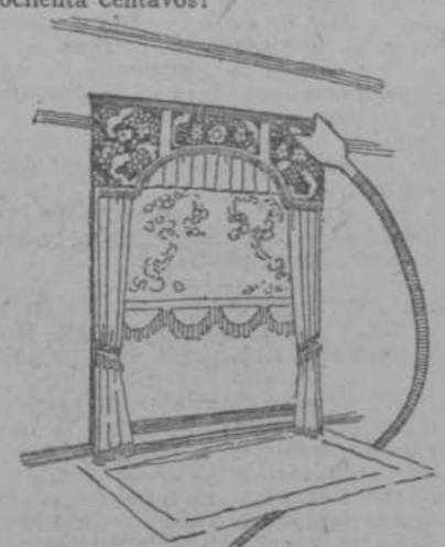
El grabado que ilustra estas líneas.

APARATOS "KIRSCH" Los aparatos Kirsch son la "última palabra" en comodidad, facilidad y eficiencia para montar las cortinas y visillos. El manejo es sencillísimo y los re- sultados inmejorables. ¡Y sólo cuestan ochenta centavos!