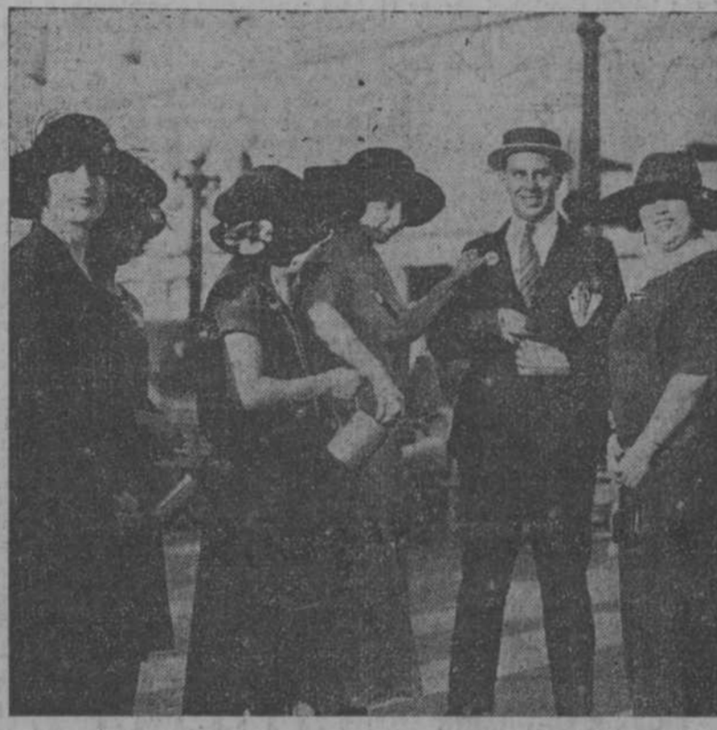
Un "asunto" que sólo está previsto y penado en el Código de la galantería