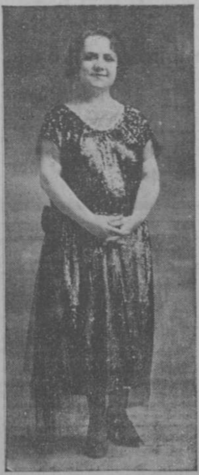
Amparo Alvarez Segura, la encantadora actriz...