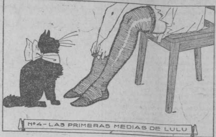
Nº4-LAS PRIMERAS MEDIAS DE LULU