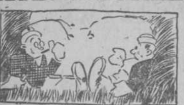
Dos de nuestros más conocidos cinegrafistas en un "comedero" esperando las palomas.

EL RUMBO CUBANO DIÓ CUATRO INDISCUTIBLES EN IGUAL NUMERO DE VECES AL BATE.—PEQUEDO DOMINO A LOS BATEADORES LOMISTAS.