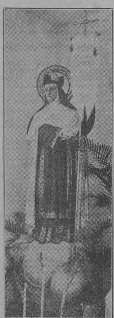
Preciosa imagen de Santa Teresa traída de Barcelona para el Colegio Teresiano.