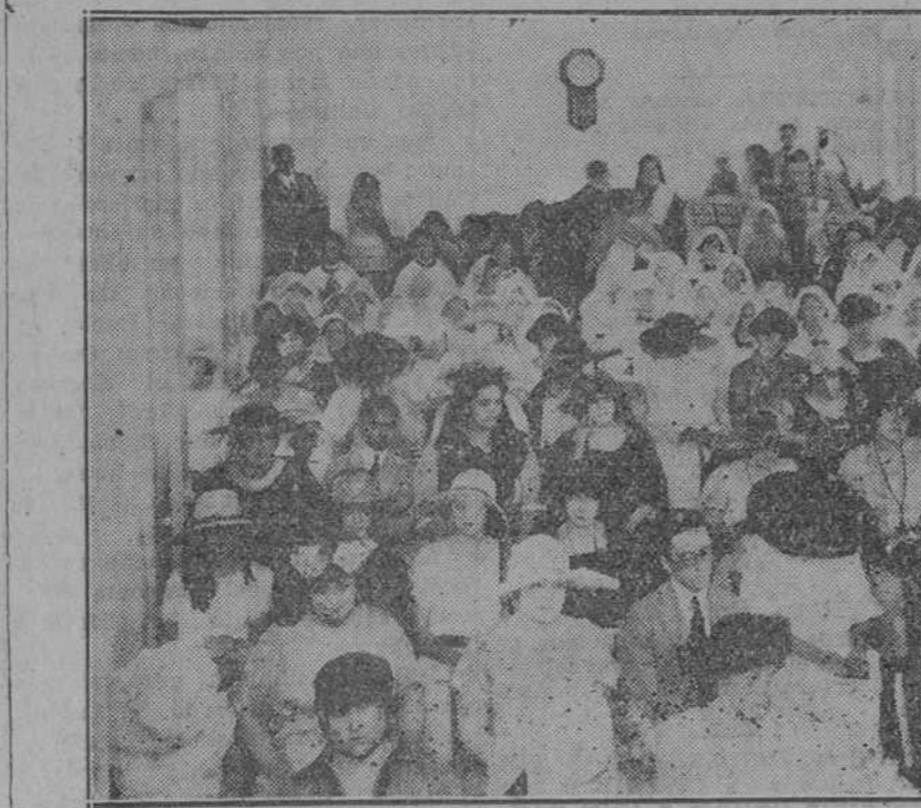
Un aspecto de la concurrencia en la inauguración del Colegio Teresiano.