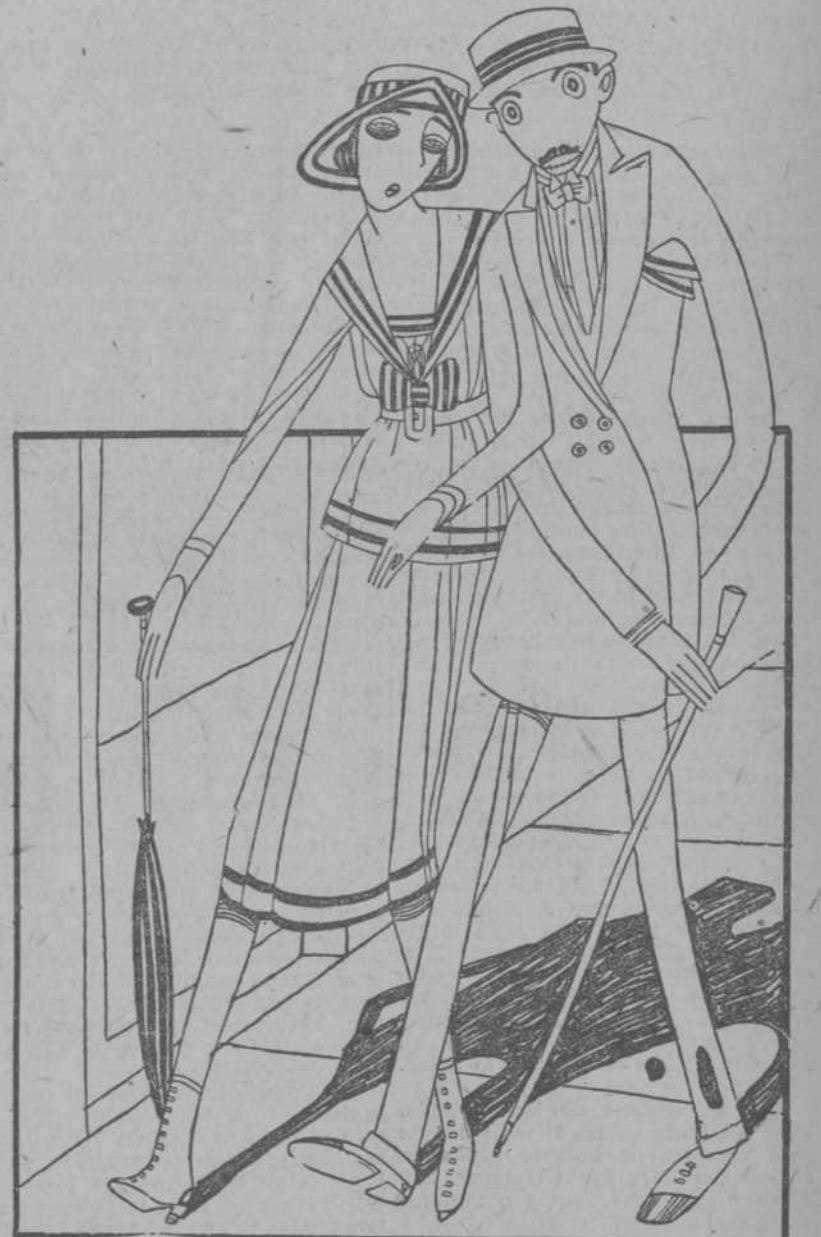
No te llevo más al teatro. ¿Por qué ese empeño de no ir a luneta? —Pero, Luisito, ¿tú no has oído decir que la gente buena va al Paraisito? (Caricatura de Carlos).