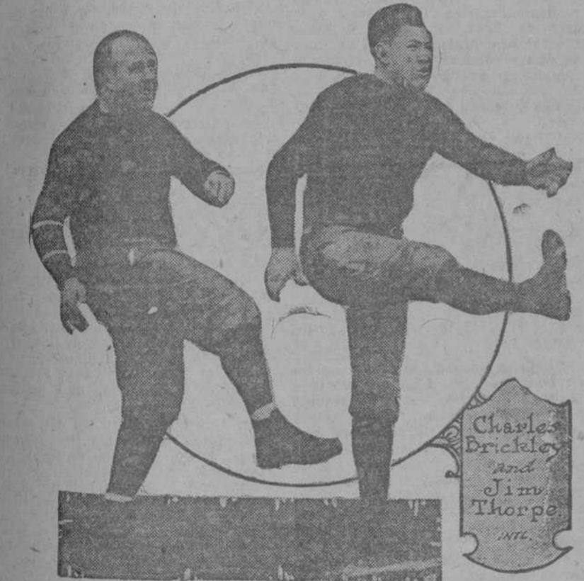
BRICKLEY Y JIM THORPE. Charley Brickley, a la izquierda, y Jim Thorpe sostienen un vigoroso duelo pateando la bola.

Charley Brickley, a la izquierda, y Jim Thorpe sostienen un vigoroso duelo pateando la bola. En Polo Grounds de Nueva York. Thorpe, el indio de Carlisle y estrella de los juegos olímpicos de Estocolmo.