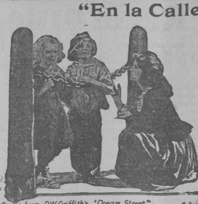
Scene from D.W. Griffith's "Dream Street."