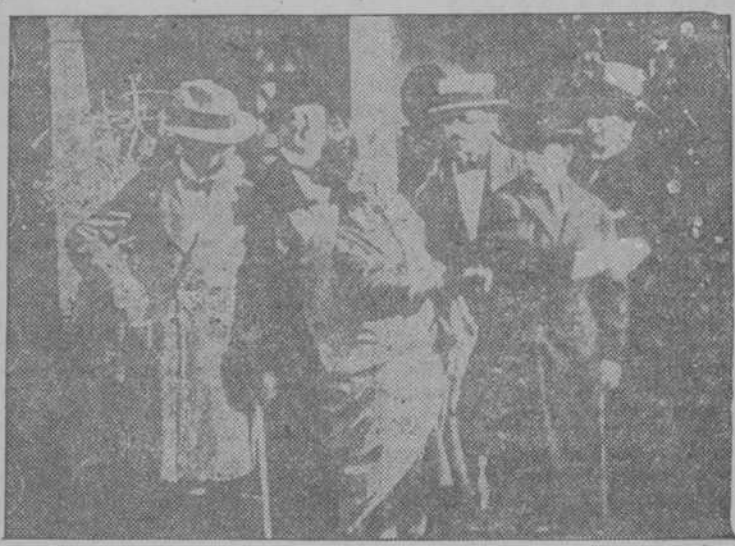
Interesante escena de la película LOS CINCO CABALLEROS MALDITOS, que anuncian Santos y Artigas estrenarán en breve. LOS CINCO CABALLEROS MALDITOS está considerada como una verdadera obra de arte y es de un argumento originalísimo.