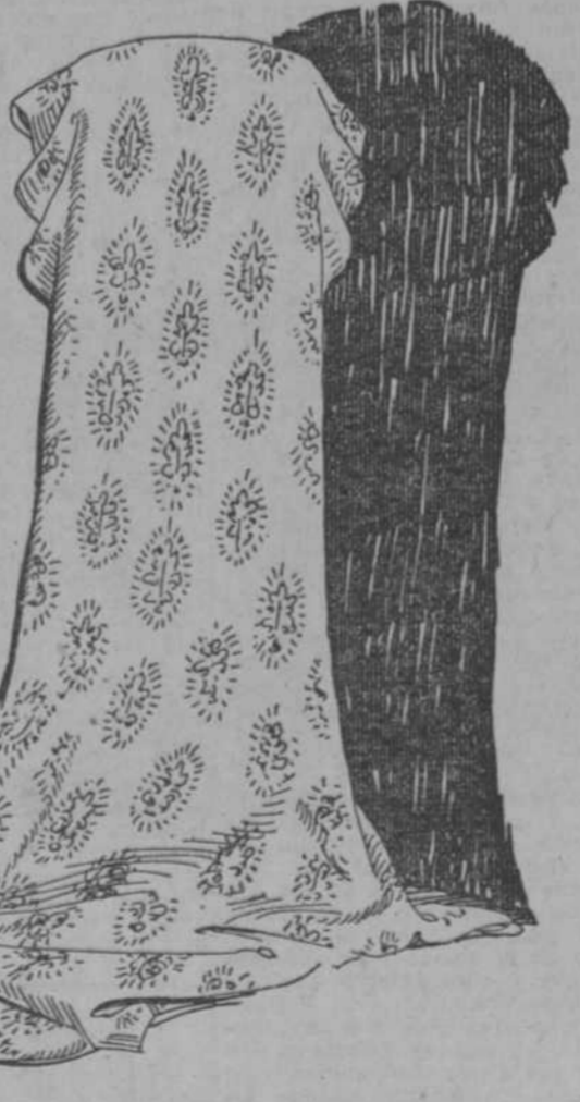
LAS DOS REALIZACIONES

Los crepés estampados están indicadísimos para blusas y sacas, según leemos en una revista de modas francesa. Los dibujos más nuevos, los estilos que actualmente privan en París, acabamos de recibirlos. En las extensas vidrieras del frente de San Rafael, por Rayo, (las mayores de la Habana) exhibimos una colección de estas fastuosas sedas que son "le dernier cri", lo último decretado por esa dama caprichosa y voluble que se llama S. M. La Moda.