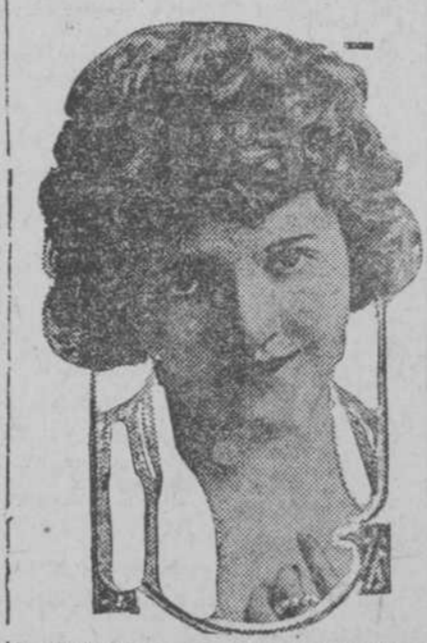
Doris May, en la producción de Thomas H. Ince "Lest's Be Fashionable" de la Paramount Artcraft Picture