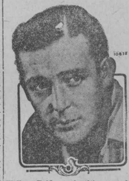
Wallace Reid, el simpático, en la cinta "The Love Special" de la "Paramount Pictures"