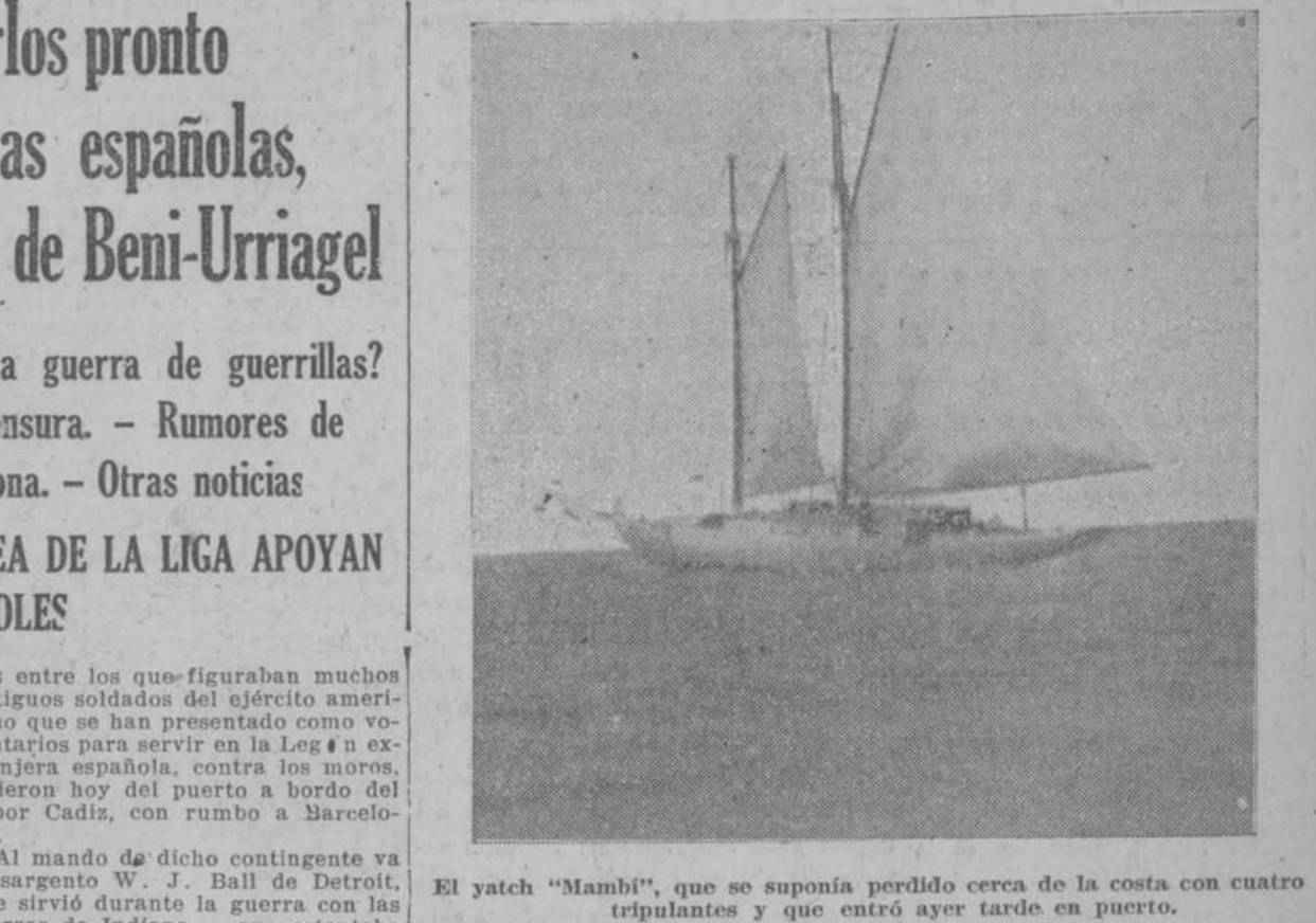
El yacht "Mambi", que se suponía perdido cerca de la costa con cuatro tripulantes y que entró ayer tarde en puerto.