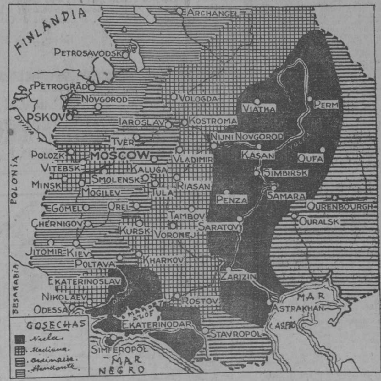
Este Mapa fué dibujado por Nicolaeff por datos oficiales suministrados por el Gobierno del Soviet y fué enviado al periódico ruso, publicado en Praga "Volga Rosai"

Y TODAVIA SE TEME QUE EN EL AÑO PROXIMO SEA MAYOR Y MAS EXTENSA.—LOS CRIMENES DE LOS BOLSHEVIKI CONTINUAN AHORA Y EL TERROR ROJO SE EXTIENDE SEGUN DIJERON EN REVAL LOS AMERICANOS LIBERTADOS.