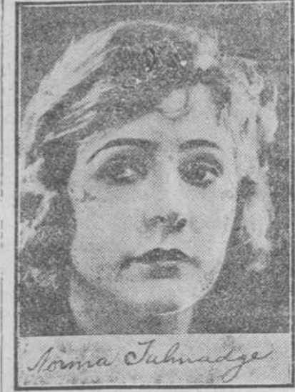
New York City, N. Y. Octubre 12 de 1917. F. F. Ingram Co.

Los espiéndidos resultados que siempre he obtenido usando su "CREMA MILKWEED," me obligan a hacer pública mi estimación por la misma. He comprobado que su crema contiene ciertos componentes específicos que tonifican el cutis conservándolo en condiciones saludables.