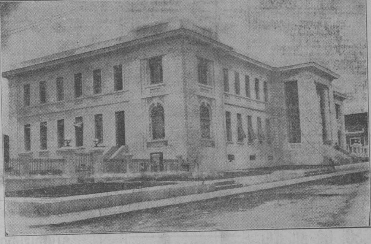
Exterior del edificio del Instituto Provincial de Matanzas, inaugurado ayer.