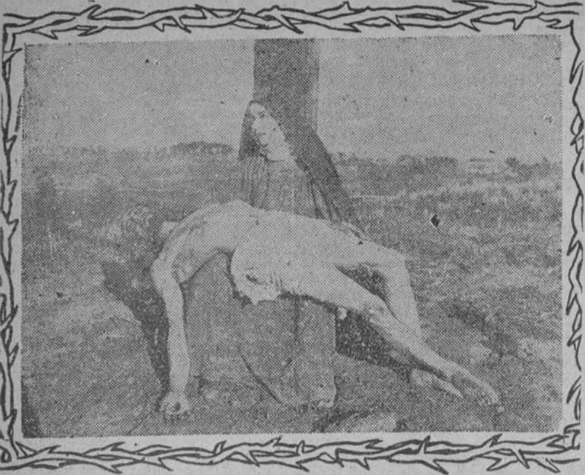
Mater Dolorosa. Precioso cuadro de la película "Christus" que exhiben Santos y Artigas en Payret.