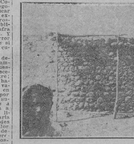
LA POSADA DEL CABO MORENO EN CUYO MURO SE VEN LAS CABEZAS COLGADAS.

Cuando más engolfados estábamos en la información sobre las últimas operaciones en Marruecos, recibimos una carta y unas fotografías, ambas cosas muy interesantes para quienes siguen con cariño el desenvolvimiento de la obra de España en el mandato de Algeciras.