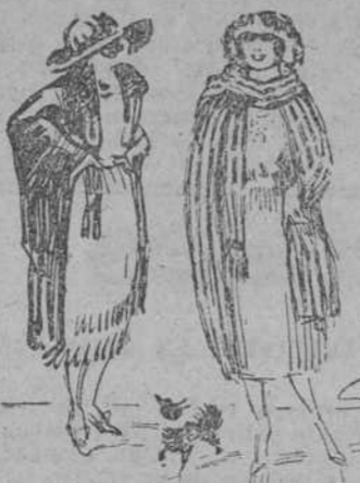
Privan hoy las bufandas—y la capa-bufanda—en las grandes

Ya ustedes las habrán visto. No nos fué posible anunciar antes la llegada. Desde hace unos días se exhiben en nuestro departamento de lencería y corsés.