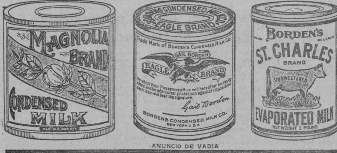
ANUNCIO DE VADIA

El nombre de "Borden", en productos lecheros, significa que esos productos se hallan al más alto nivel de la excelencia. Por espacio de 59 años ese nombre ha sido para el público una garantía de la mejor calidad y buena fé. La confianza del público se refleja en el aumento incesante en la venta de los productos de "Borden."