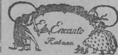
C. S280 1d-12 1t-12

No se podrán ver hasta que oficialmente inauguramos la temporada de invierno.