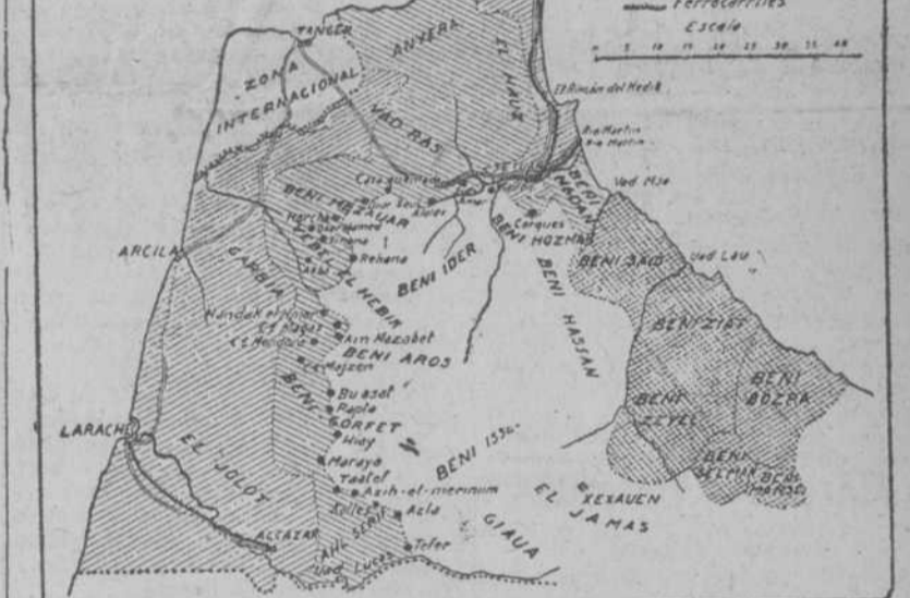
ZONA ORIENTAL DEL MARRUECOS ESPAÑOL.