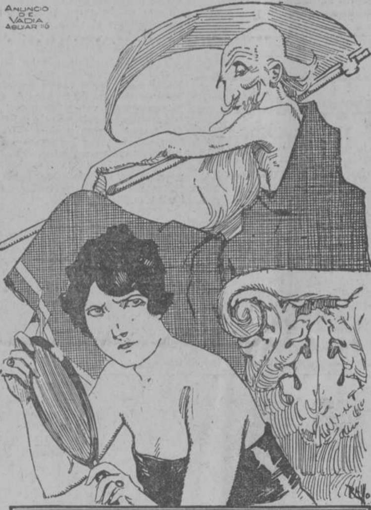
ANUNCO VADIA ABARIS

Una Santa y sabia castellana, la virginal Teresa, da nueva vida a aquel