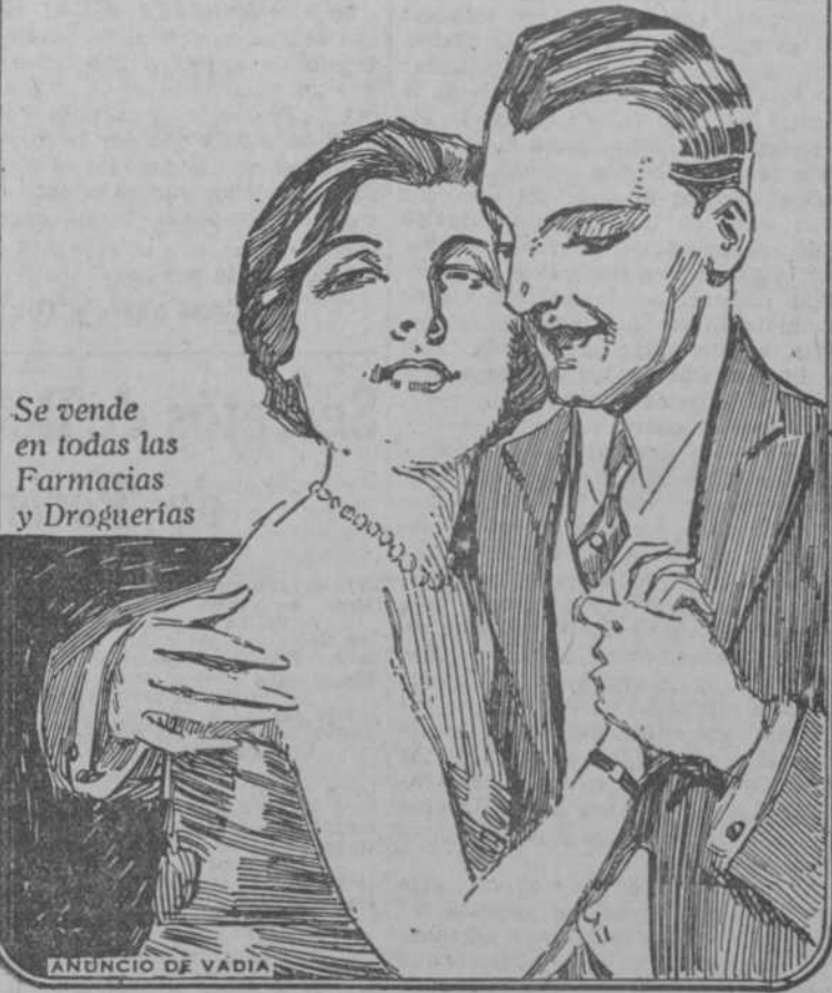
Se vende en todas las Farmacias y Droguerías

PREPARADO POR Frederick Stearns & Co., Detroit, E. U. A. CASA ESTABLECIDA EN 1855