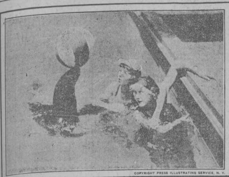
Jóvenes neoyorkinas jugando a la pelota con una foca.