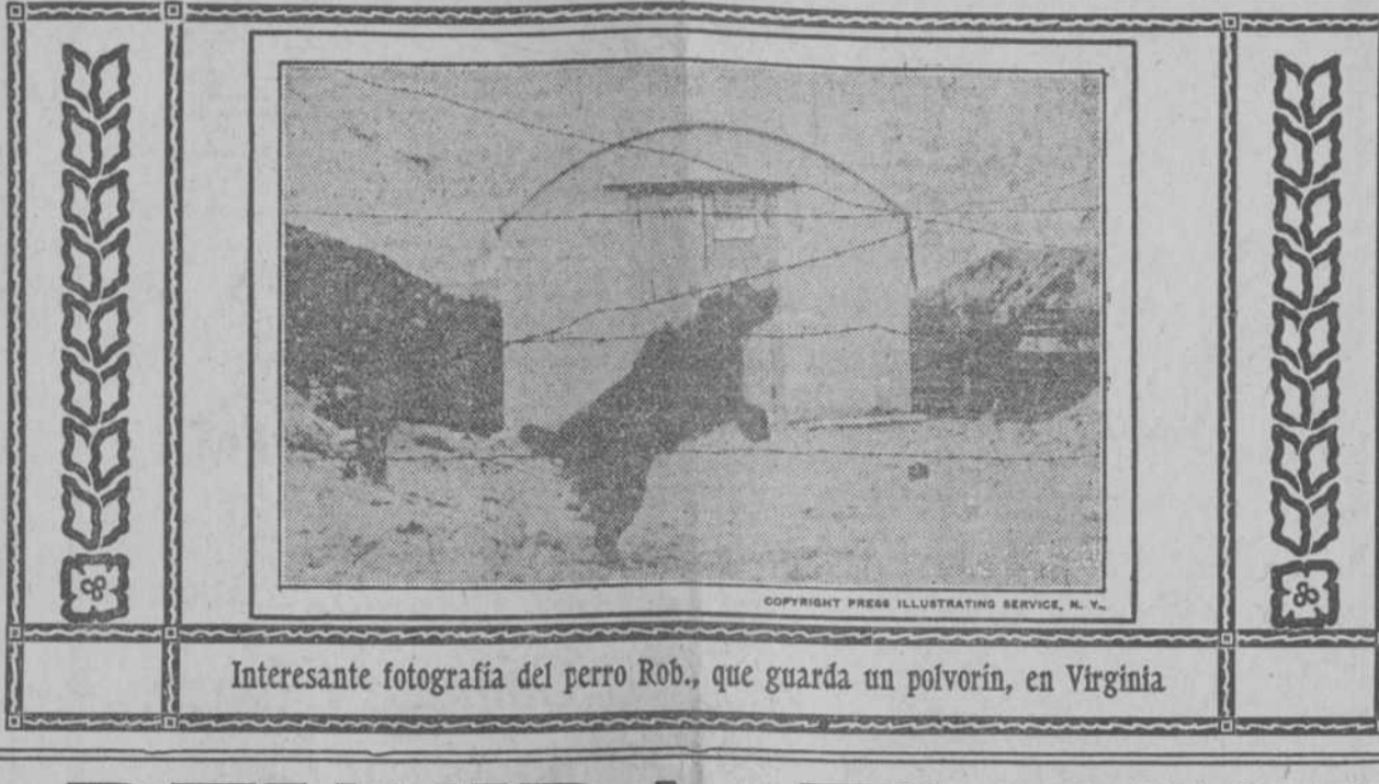
Interesante fotografía del perro Rob, que guarda un polvorin, en Virginia