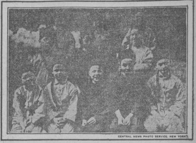
Chinitos convertidos al Cristianismo, por las misiones de Hong-Kong.