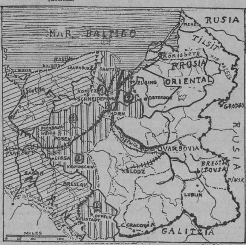
Los números 1 señalan el "Corredor" que ahora se discute y que se halla a ambos lados del río Vístula.—Los dos números 2 más altos indican lo que ha recobrado Polonia de Prusia en la Provincia de Posen. El tercer número 2, situado más abajo, marca la parte de la Silesia alemana que se ha dado a Polonia.