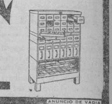
ANUNCIO DE VADIA

MORGAN & WALTER OFFICE EQUIPMENT CO. AGUIAR 84 TEL. A-4102