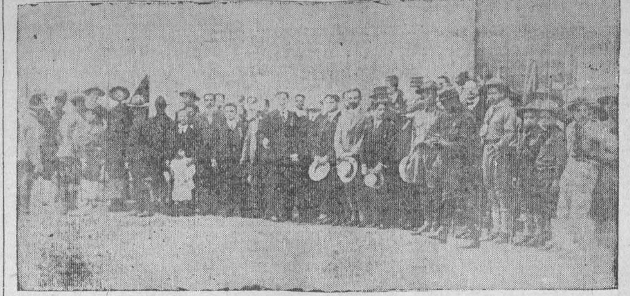
Uno de los grupos de los Caballeros de Colón y Boy Scouts asistentes al Angelus de la Paz