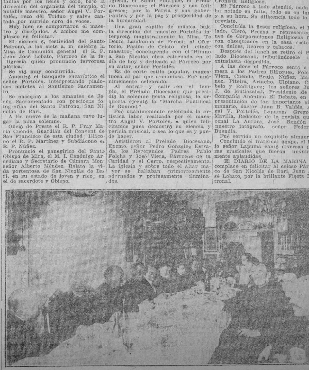
Un grupo de concurrentes a la Fiesta Patronal de San Nicolás de Bari

PILDORAS VITALINAS CONSERVAN LAS FUERZAS FISICAS, LAS RENUEVAN, LAS ACTIVAN. Revordecen la juventud, alejan el cansancio de los años. Dan energías, fuerzas, ánimos a los desgastados por excesos o por la edad. DE VENTA EN TODAS LAS BOTICAS DEPOSITO: "EL CRISOL", NEPTUNO Y MANRIQUE