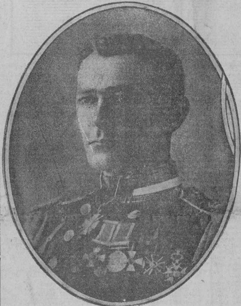
Capitán Francis Newton Allen Cromie, de la marina británica, asesinado por los Bolsheviki en el mismo edificio de la Embajada Inglesa en Petrogrado, cuando defendía el archivo diplomático.

A. Mejías, Pedro Belancourt.—Aunque no haya nacido en el territorio de la República es considerado como cubano. Debe solicitar su inscripción. (Continúa en la página SEIS.)