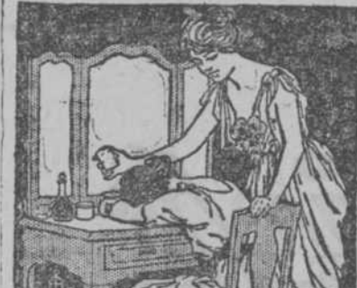
No sientes pasar por tu cutis el

La manteca está a cuarenta centavos la libra. Un precio equitativo, ¿verdad? ¡Ah, pero el que hizo la ley hizo la trampa! Como el precio de 40 centavos no significa la calidad de la manteca, en vez de manteca de chicharrón se está vendiendo manteca de sebo, con lo que resulta que ganan más los que venden esa manteca a cuarenta centavos que los que vendían la otra a ochenta. Ahora nos explicamos por qué el Alcalde no pone a diez centavos la botella de leche. Si ésta ahora tiene agua, ¿qué