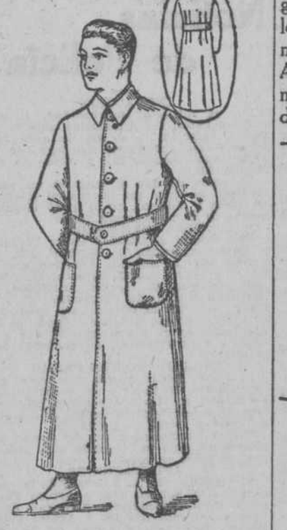
Surtidos de Guardapolvas, crudos y color acero, a $2.50.