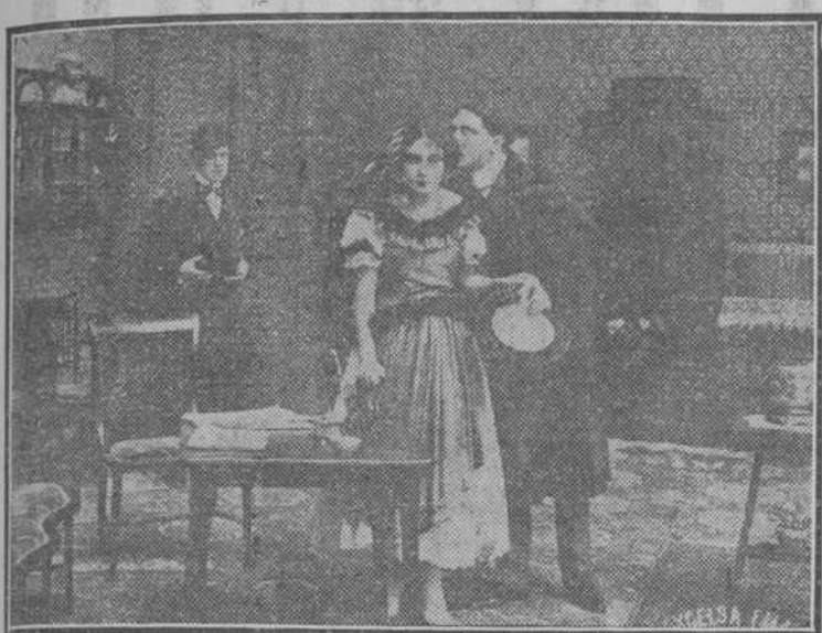
UNA ESCENA DE "QUIEN ME HARA OLVIDAR SIN MORIR..."