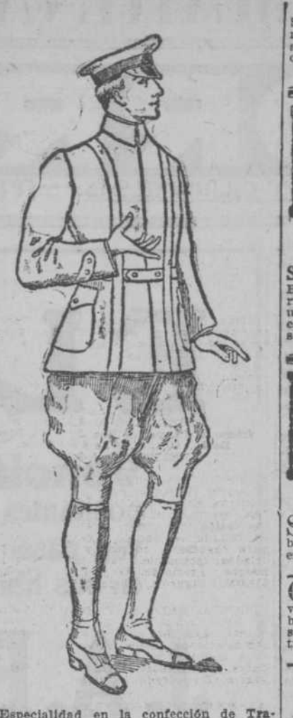
Especialidad en la confección de Trajes de Chauffeurs.