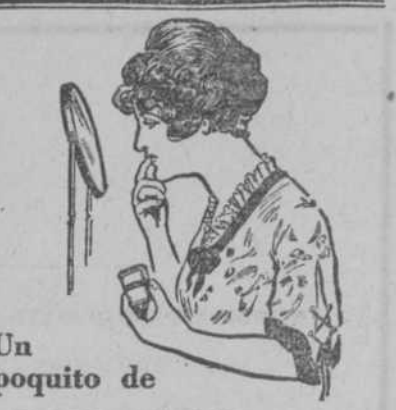
Un poquito de

Muchos libros podrían escribirse acerca de Sarah Bernhardt, cuya visita a esta ciudad constituye la sensación de la temporada dramática. El arte de Madame Bernhardt es su título principal a la fama. Pero hace tiempo muchos millones la conocen y admiran por motivos de carácter más personal. No hace mucho que dió pruebas de su valor, visitando animosamente el frente de Flandes, donde recitó y representó en obsequio de