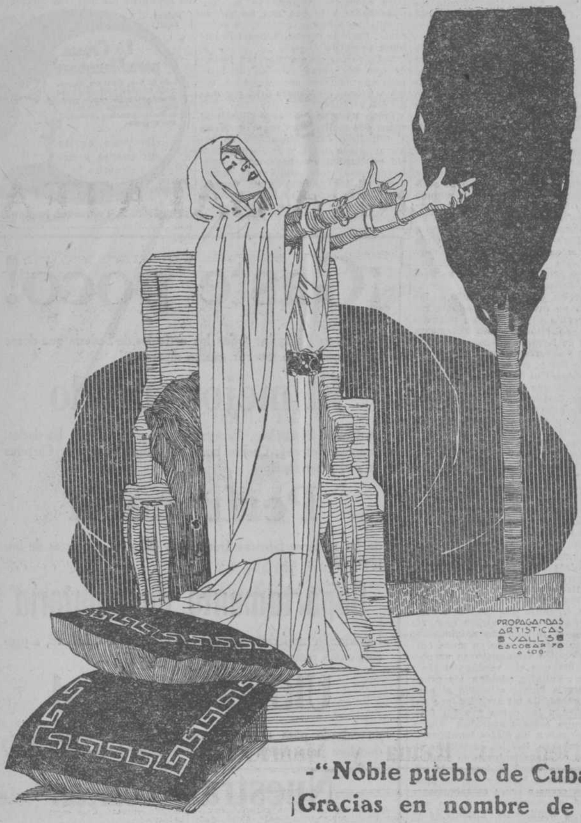
-Noble pueblo de Cuba: ¡Gracias en nombre de mi Francia!