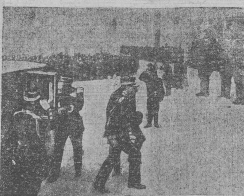
Llegada del Rey de Grecia a la Catedral de Atenas, donde se celebró un solemne Te-Deum en honor de la toma de Jerusalem.