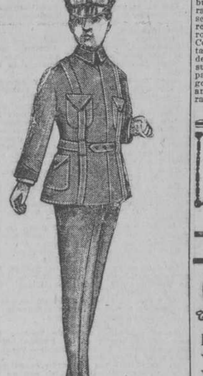
Telas mojadas. Corte perfecto. Rapidez en la entrega.