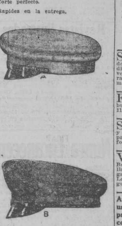
Surtido completo de gorras, fajas y estilo militar.

TEMPORAL RAMON MENENDEZ Teléfono A-3787 BELASCOAIN Y SALUD