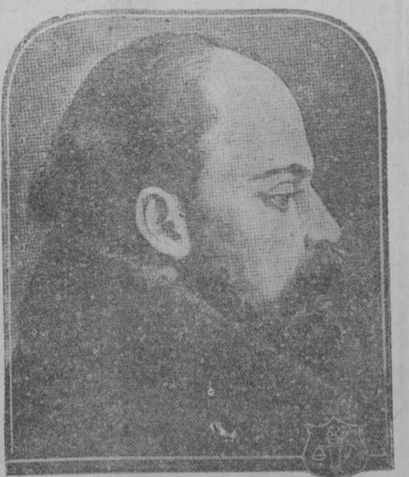
Nikolai Lenin, Presidente de los Comisarios (Ministros) de Rusia.