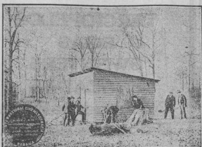
UNA ESCENA DEL GRAN SECRETO