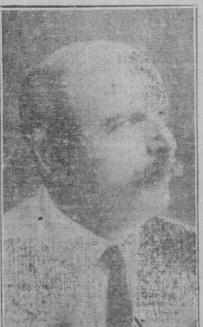
Don Manuel Ruiz Rojas, Alcalde Municipal de Santa Clara.

Visitamos al popular Alcalde Municipal de Santa Clara, Don Manuel Ruiz, en su despacho, para cambiar impresiones sobre el conflicto de las obras en la Estación de Ferrocarril