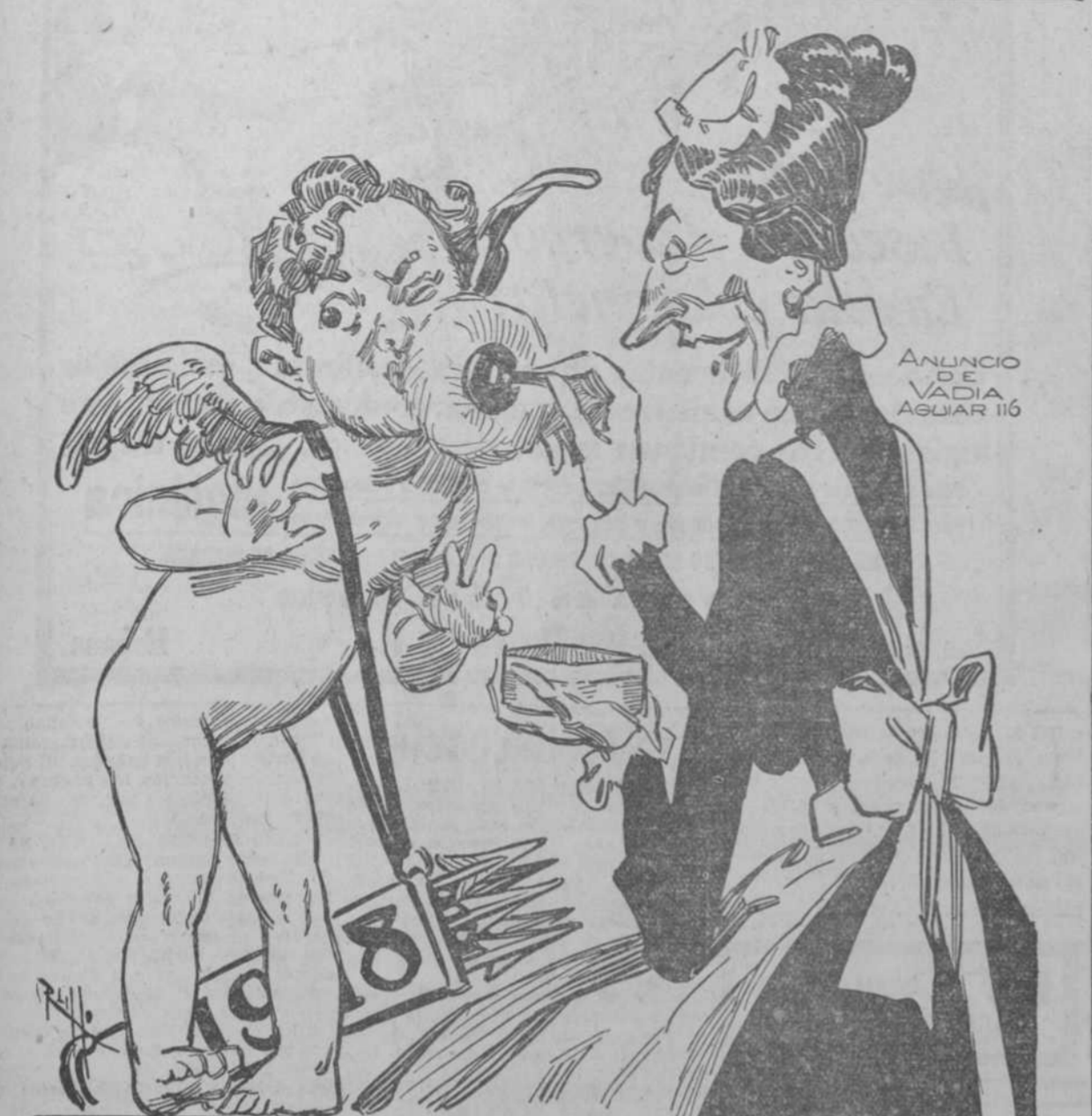
ANUNCIO DE VADIA AGUIAR 116

Estas líneas escritas por mí cuando las hace sonreír cuando están tristes, porque es poderoso reconstituyente que hace nacer colores en las mejillas. Se venden en Neptuno 91 y en todas las boticas. Suscribese al DIARIO DE LA MARINA y anúnciese en el DIARIO DE LA MARINA