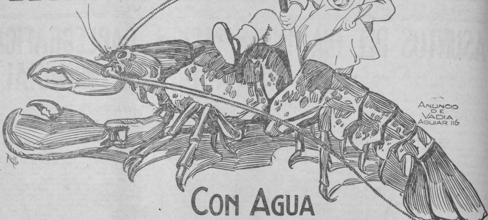
ANUNCIO DE VADIA AGUIAR 116