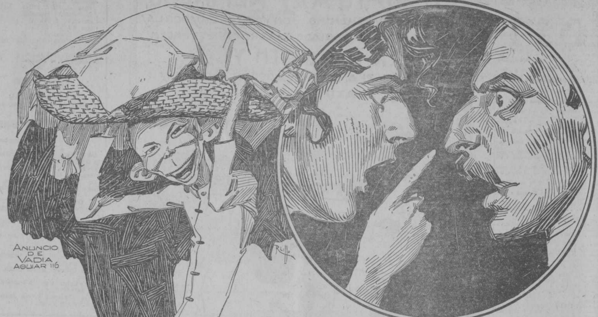
ANUNCIO DE VADIA AGUIAR 116

Joyería de brillantes. GALIANO, 88-A. Entre San Rafael y San José. CS907 alt. 151-3