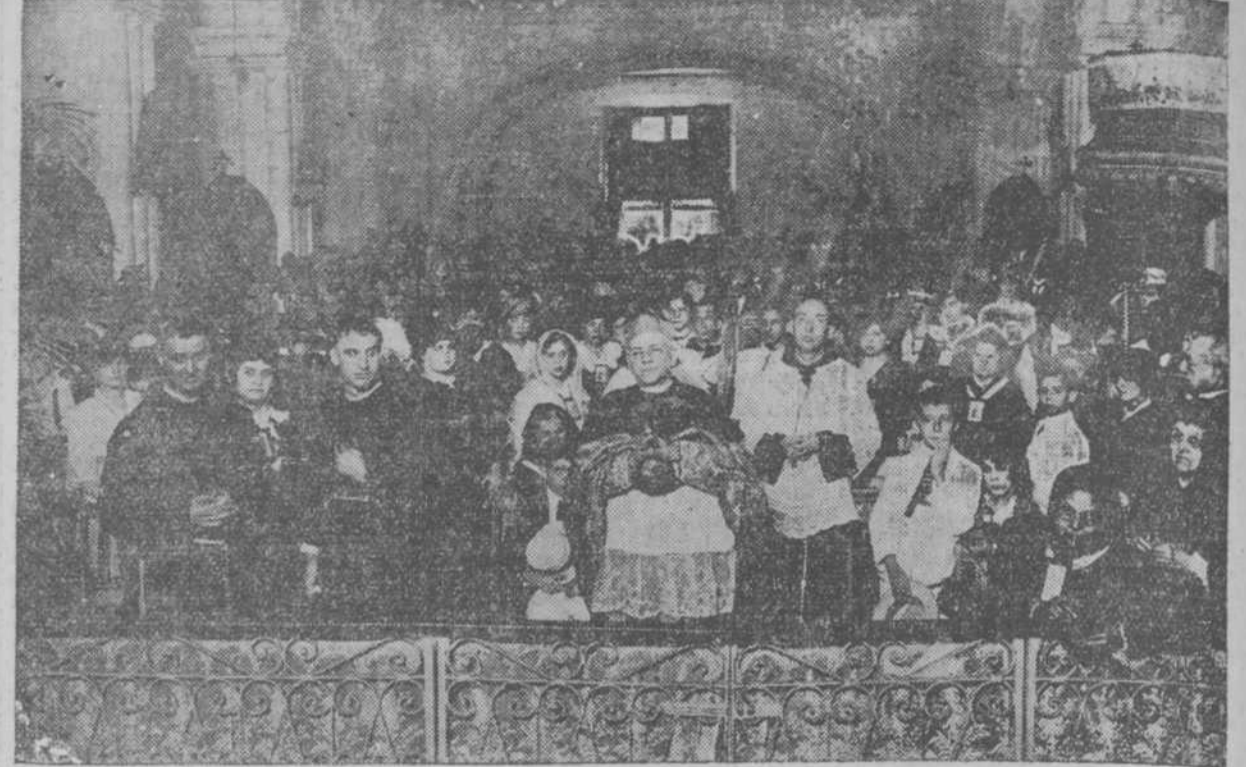
El Delegado Apostólico, Padres Franciscanos y Terciarios, en el templo, momentos antes de dar comienzo a la solemne función

Una estatua ecuestre merece en las ciudades de Marruecos, otra de gobernante en las ciudades de la Península, otra de sabio en las Universidades y otra de fraile y santo en los altares. Esta voz resonó en el corazón de la Orden Seráfica de Cuba y de la V. O. Tercera de esta ciudad, y se preparó a celebrar dignamente el Cuarto Centenario de la muerte del Cardenal Cisneros, organizando un Certamen Literario, y solemnes fiestas religiosas en acción de gracias al Señor, por haber dotado a nuestra raza de un hombre tan insigne, y también para hacer pública profesión de fe, de la fe que tan grande hizo a España, y con ella a sus colonias, hoy las naciones latino-americanas, gloria de este Continente y de la nación progenitora.