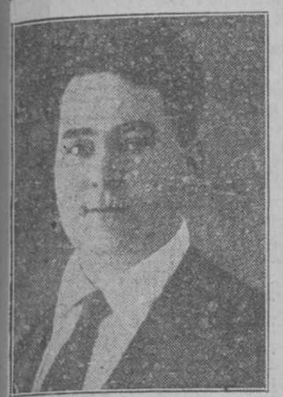
AMADEO FARNADAS Un gran tenor catalán