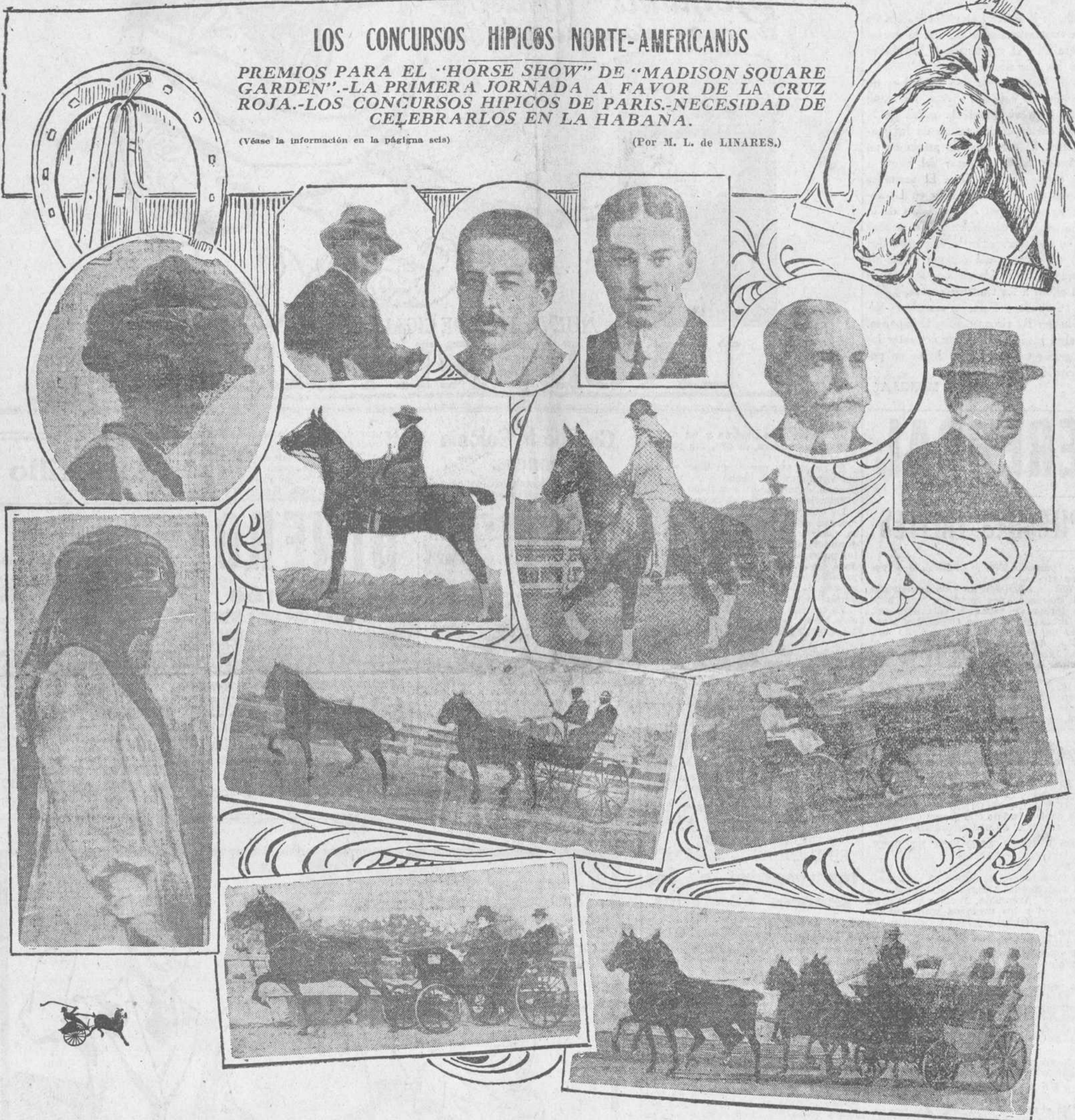
LOS CONCURSOS HIPICOS NORTE-AMERICANOS PREMIOS PARA EL "HORSE SHOW" DE "MADISON SQUARE GARDEN".-LA PRIMERA JORNADA A FAVOR DE LA CRUZ ROJA.-LOS CONCURSOS HIPICOS DE PARIS.-NECESIDAD DE CELEBRARLOS EN LA HABANA.