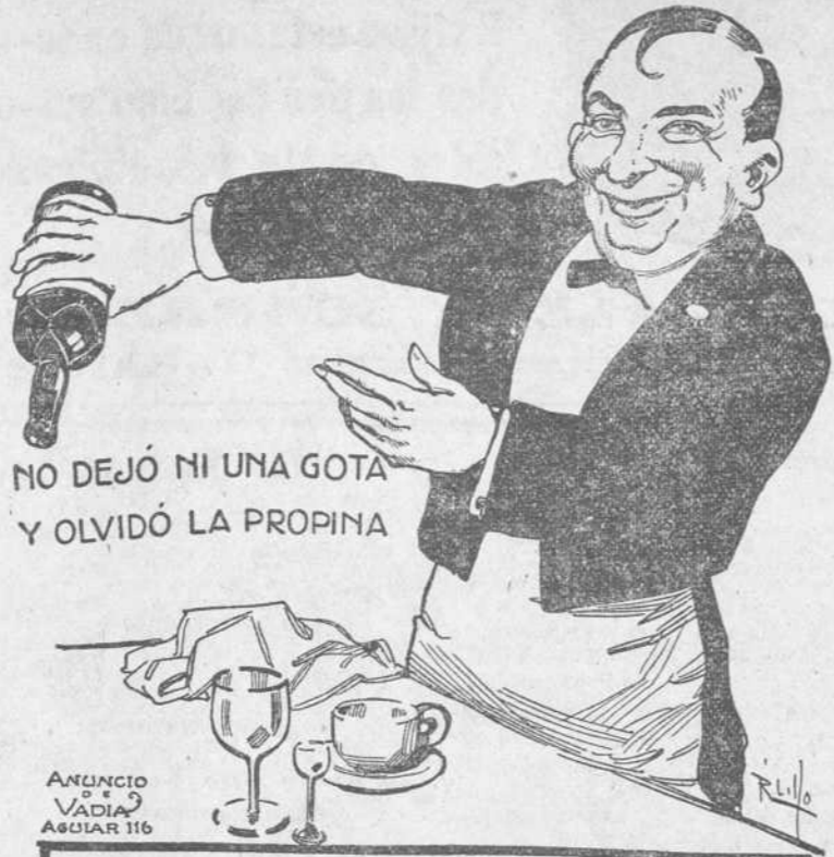
NO DEJÓ NI UNA GOTITA Y OLVIDÓ LA PROPINA