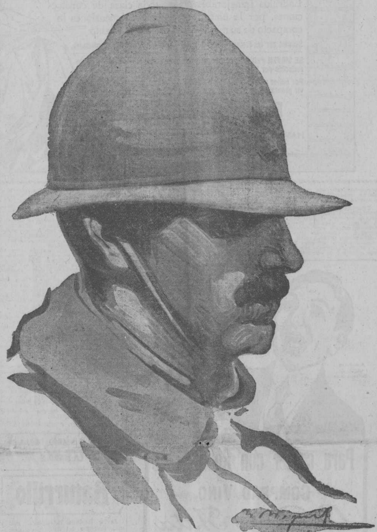
Soldado francés, con el nuevo casco.—Dibujo de Mariano Miguel.