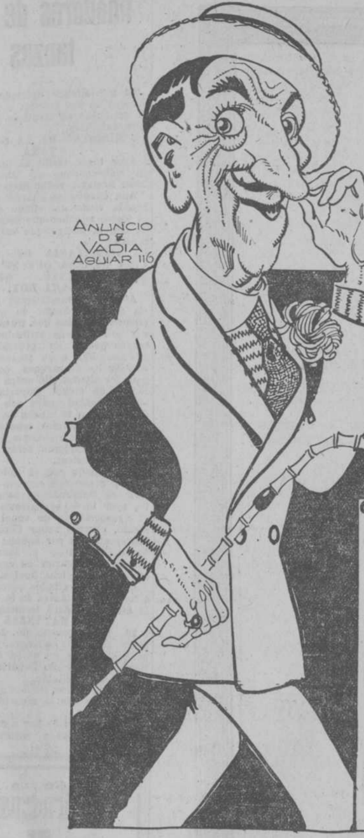
ANUNCIO DE VADIA AGUIAR 116

De aquí hacen inmensas espirales, convergentes hacia el centro cuando el tiempo se enturbia y malicia, o divergentes si ocurre lo contrario, y el buen tiempo se afirma.