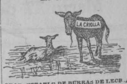
GRAN ESTABLECIMIENTO DE BURRAS DE LECHE DE MANUEL VAZQUEZ

Belascon y Ponce. Tel. A-4511. Burras criollas, todas del país, con servicio de domicilio, en el establo, a todas horas del día y de la noche, pues tengo un servicio especial de mensajeros en bicicletas para despachar las ordenes a las casas que se reciben.