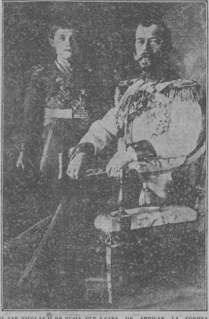
EL CZAR NICOLAS II DE RUSIA, QUE A CABER DE ABDICAR LA CORONA, ACOMPAÑADO DE SU HIJO, EL PRINCE ALFONSO ALEXANDROVICH, HEREDERO DEL TRONO, QUE NACIO EL 12 DE AGOSTO DE 1904.

des el domingo, junta con la que daba cuenta de haber ocurrido motines en Petrogrado debido a la escasez de comestibles, los cuales, aunque según las noticias telegráficas no fueron de gran importancia, causó aquí cierta sospecha de que los acontecimientos se iban desarrollando.