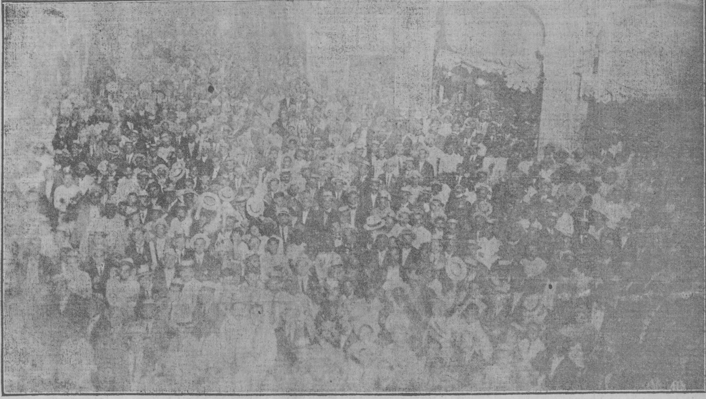
EL PUBLICO EN MASA CONGREGADO ANOCHE FRENTE A LA PIZARRA DEL "DIARIO DE LA MARINA," LEYENDO NUESTROS PARTES DE AVANCE SOBRE LAS ELECCIONES.

Corresponsal. Telegrama del corresponsal de Oriente, anuncia que la lucha electoral fué reñida, llevando los liberales alguna ventaja, en los colegios escrutados. (PASA A LA ULTIMA.)