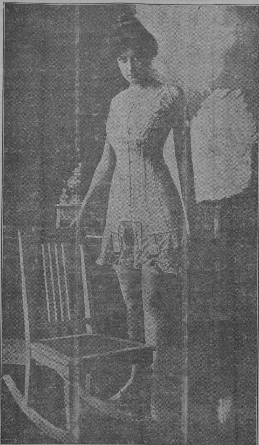
El corsé "BON-TON" tiene el privilegio de producir un cuerpo así, tan elegante.