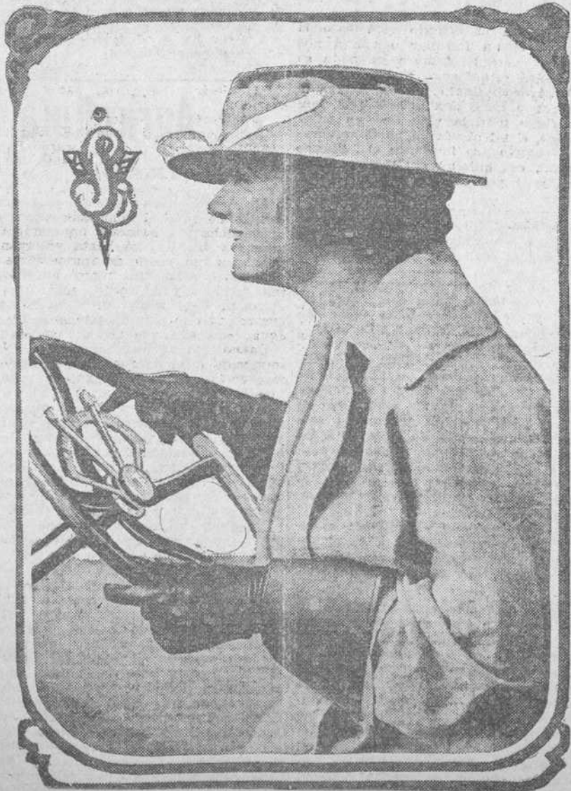
Traje y sombrero para deportes.