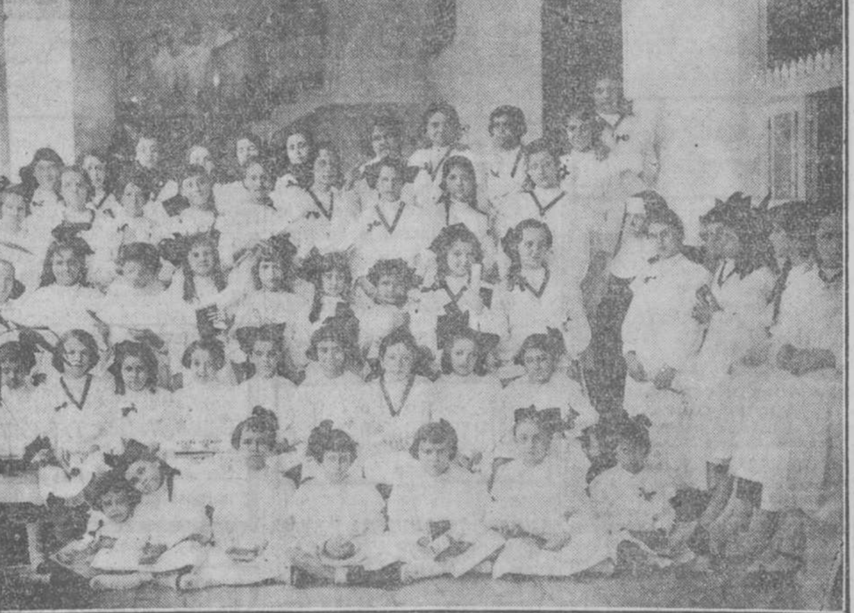
UN GRUPO DE ALUMNOS PREMIADAS DEL MISMO PLANTEL.