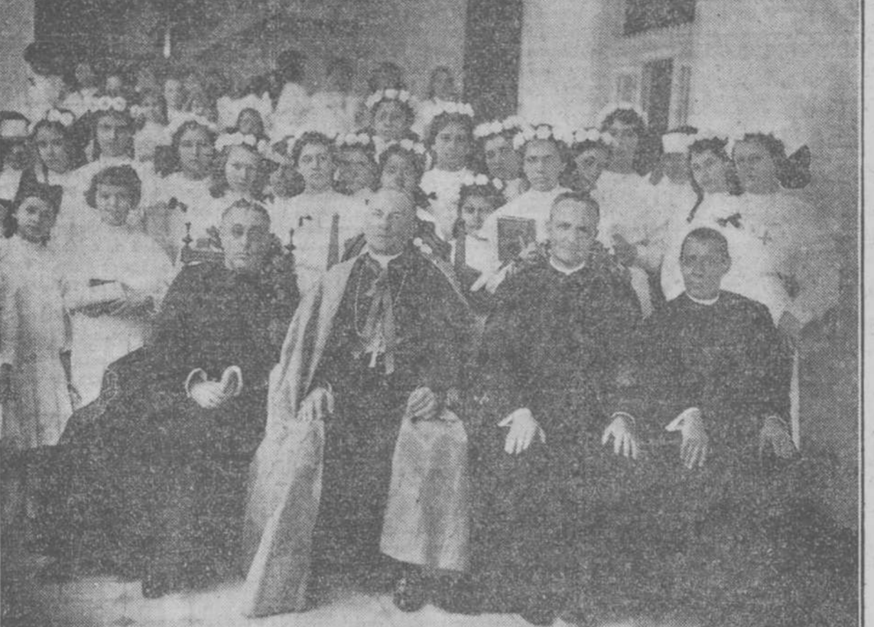
EL DELEGADO APOSTOLICO, EL CAPELLAN Y ALUMNOS SOBRE SALIENTES DEL COLEGIO DE LAS URSULINAS.