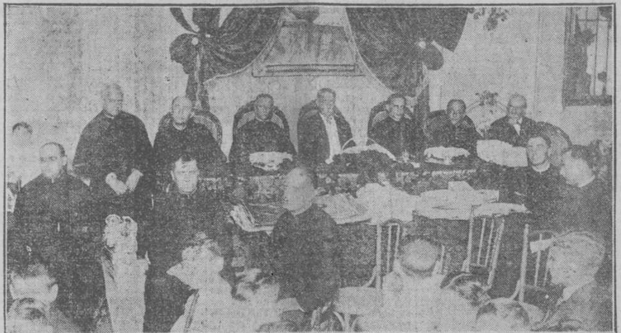
Distribución de premios a los alumnos de las Escuelas Pías de Guanabacoa.—La Presidencia del solemnísimo acto.

Pese a la inclemencia del tiempo, que restó público al acto de la solemne distribución de premios a los alumnos que de modo brillante han terminado los estudios del presente año escolar, fué numerosísima y distinguida la concurrencia que ocupó el salón de actos del Colegio de Guanabacoa.