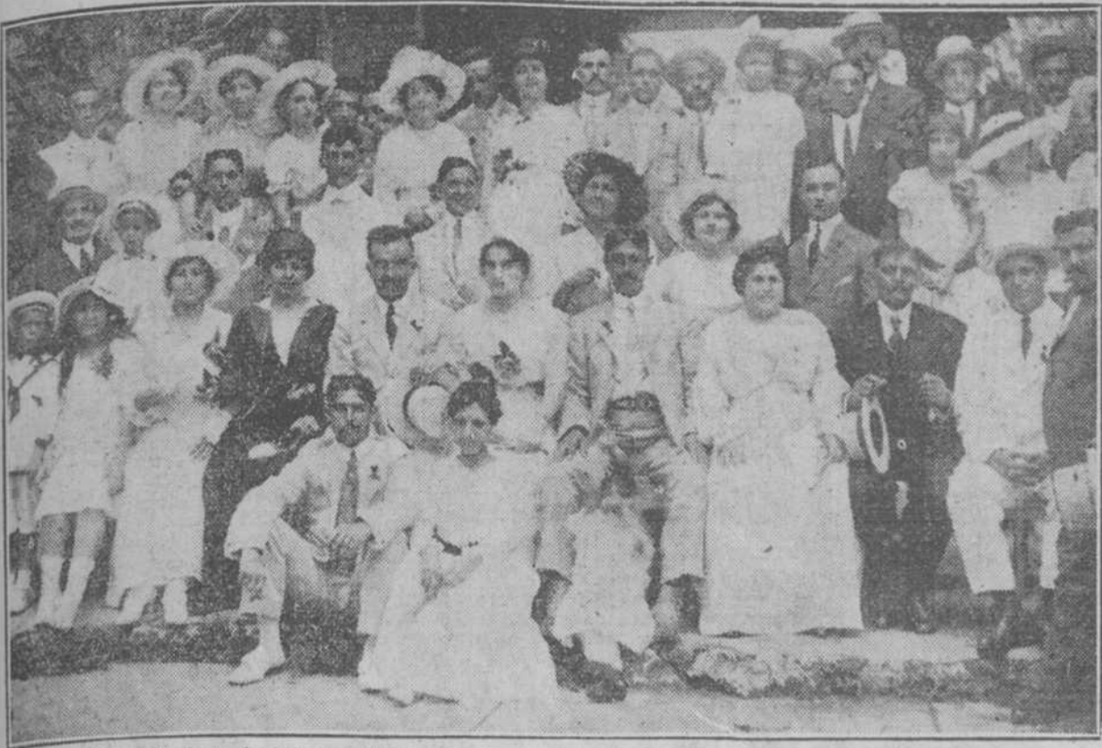
El Presidente de los en usistas pravianos, rodeado de un hermoso grupo de romeros.