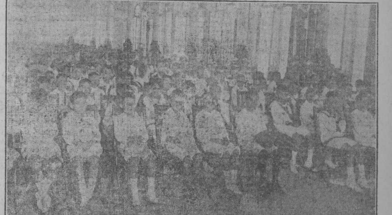
Los alumnos del plantel, esperando la distribución de premios