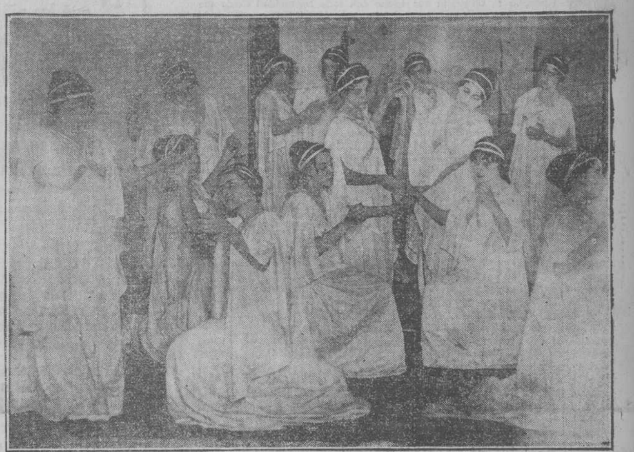
Grupo de "Vestales" formado por las señoritas que este curso han terminado sus estudios en la Normal de Kindergarten.

CON UN BELLO PROGRAMA, AL FINALIZAR EL CURSO, DESPIDEN SUS CONDISCIPULAS A LA NUEVA PROMOCION DE PROFESORAS. NOTABLE EXPOSICION DE TRABAJOS MANUALES