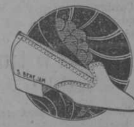
ESTILO 303 D