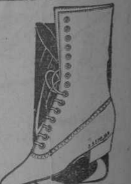
ESTILO 54 B