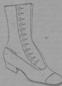
ESTILO 337 N