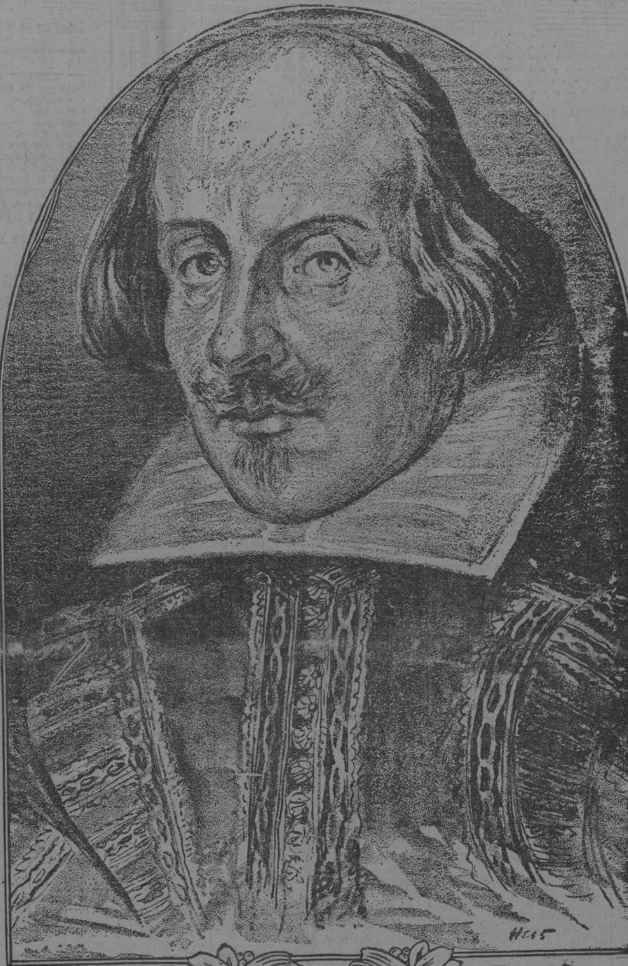
En el día de hoy, 3 de Mayo, se cumplen tres siglos justos de la fecha en que murió el poeta más grande y portentoso de Inglaterra.

William Shakespeare falleció el 23 de Abril de 1616, conforme al calendario Juliano que regia entonces en Inglaterra; y aquel día correspondió al 3 de Mayo de 1616 del calendario Gregoriano, que rige hoy en el orbis cristiano, excepto en Rusia, Grecia y las naciones balcánicas.