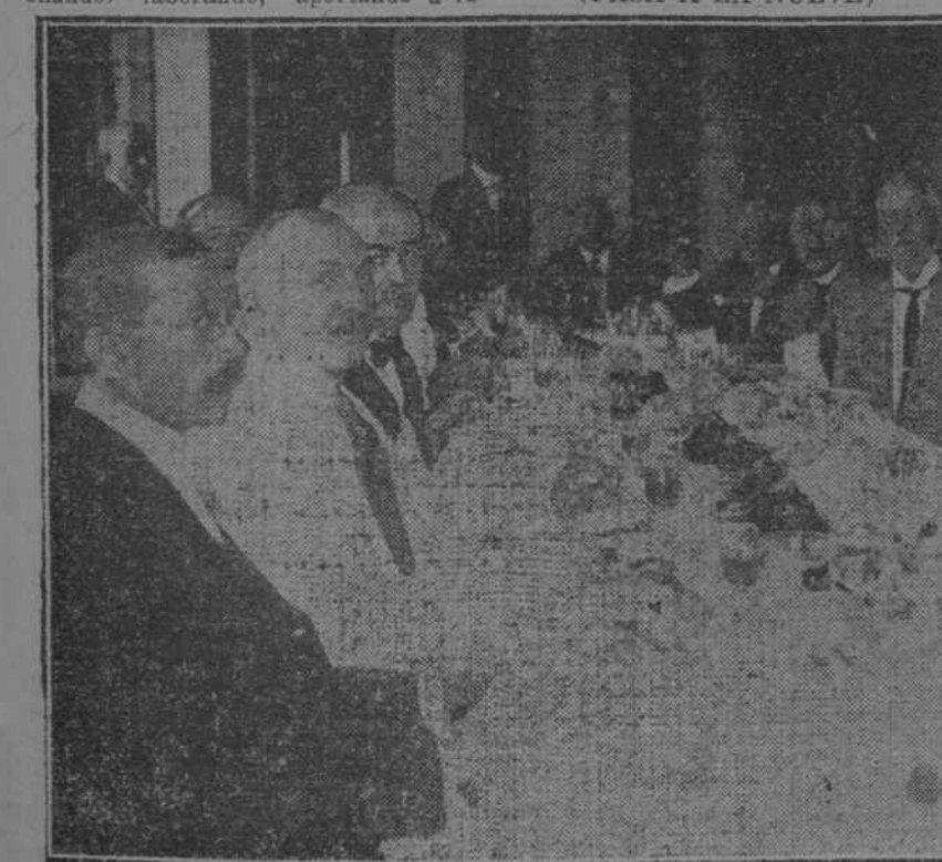
EL BANQUETE EN EL CENTRO ASTURIANO