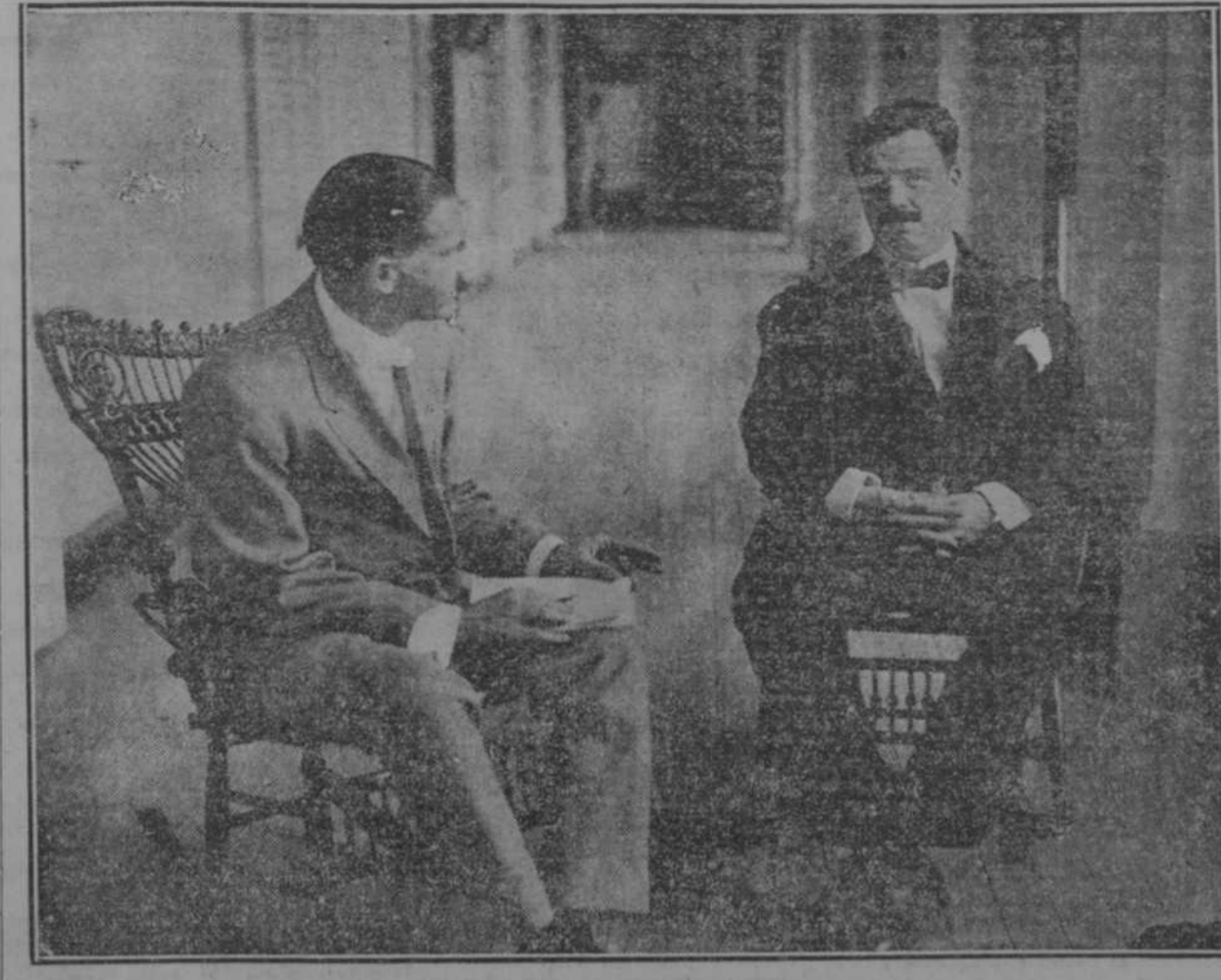
EL PROFESOR CARLOS OCTAVIO BUNGE INFORMANDO DE SU MISION A NUESTRO COMPASERO EN UNA GALERIA DEL HOTEL TROTCHA

El Dr. Bunge inicia la aproximación espiritual de Cuba y la República del Plata. - La Conferencia de mañana en el Ateneo.