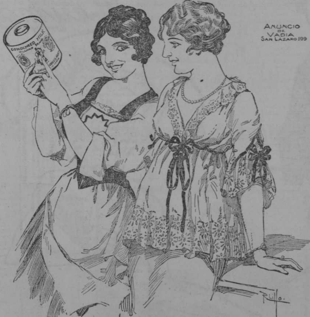
ANUNCIO DE VIDA SAN LAZARO 199

Mi retrato está en todas las latas de Leche Lechera. LECHERA, es la marca de leche que prefieren las madres de familia porque es el mejor alimento para sus hijos; los engorda, hace fuertes, saludables y felices.