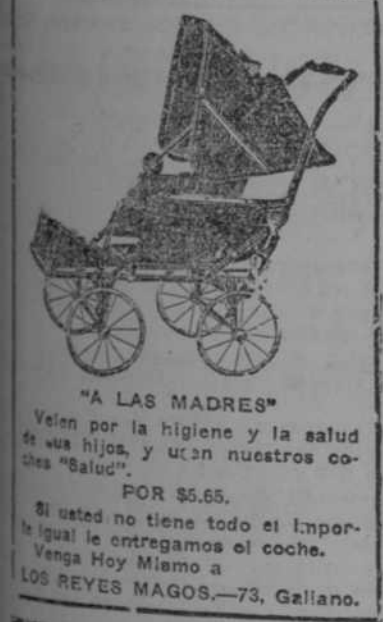
"LAS MADRES" Venen por la higiene y la salud de sus hijos, usen nuestros coches "Baldu".

Es inútil que los diplomáticos limpien de ansias de usura sus espíritus y se dispongan a proceder con nobleza; el hombre es víctima eterna del error; y al fin los tratados de paz llevan los pueblos a la guerra. Es baldío que se firmen alianzas comerciales entre las naciones; que se suscriban compromisos de Derecho internacional; que se haga profesión de fe pacifista... ¡La guerra surge al fin! Y es que el hombre, como previó aquel ser extraño e impasible, amigo de los versos y de las mujeres, y tocado por la mano del inio, se empeña en ir contra las corrientes de la armonía universal... Y mientras así proceda, el desenlace tiene que ser trágico... No por su espíritu de mojigatería, ni por su propósito de predicar, una vez más queremos decir [hasta qué punto, sólo en las doctrinas de Jesús puede hallarse la tranquilidad! "Amaos los unos a los otros..." He aquí unas san-