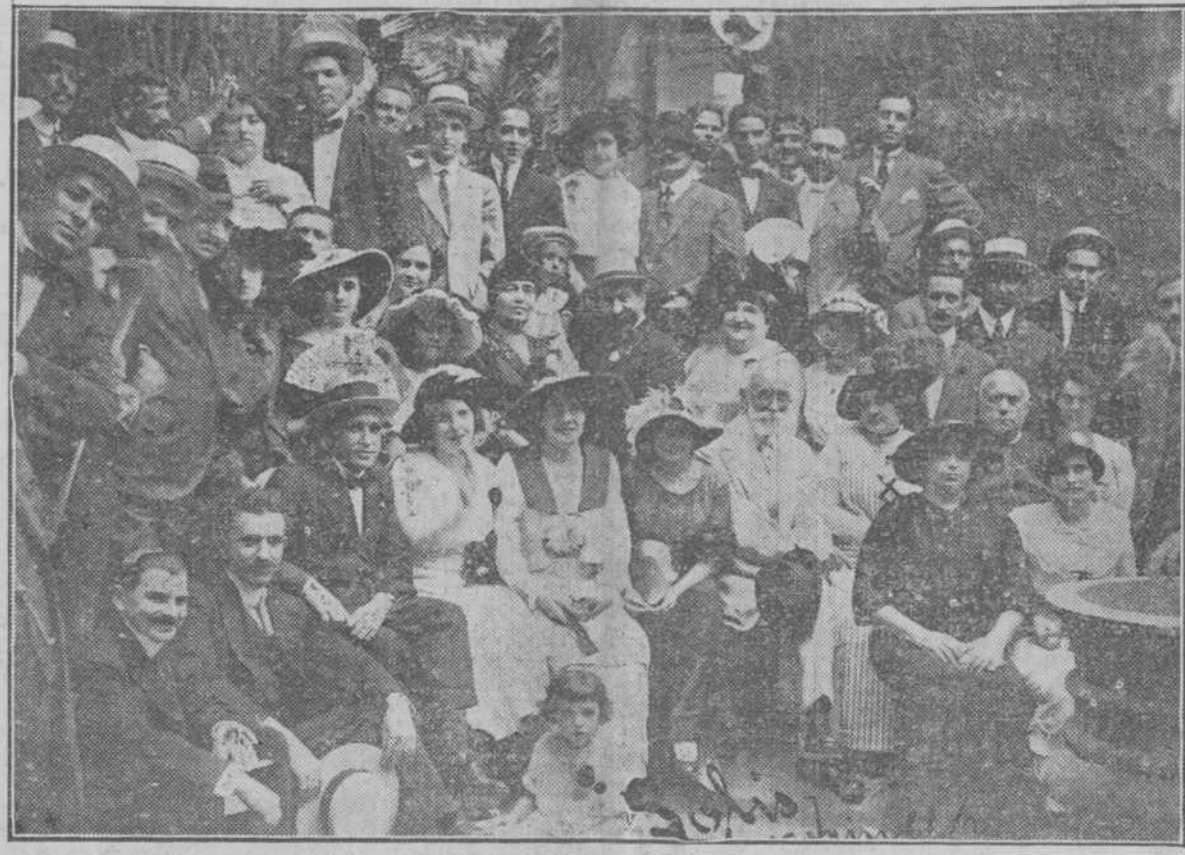
EL CIRCULO PRAVIANO.—UN GRUPO DE CONCURRENTES A LA BENDICION DEL ESTANDARTE RODEANDO A NUESTRO DIRECTOR

La cabalgata pasa.-Bendición del Estandarte.-Banquete florido.-Gran baile.-Los forasteros "de fuera".-Desfile brillante